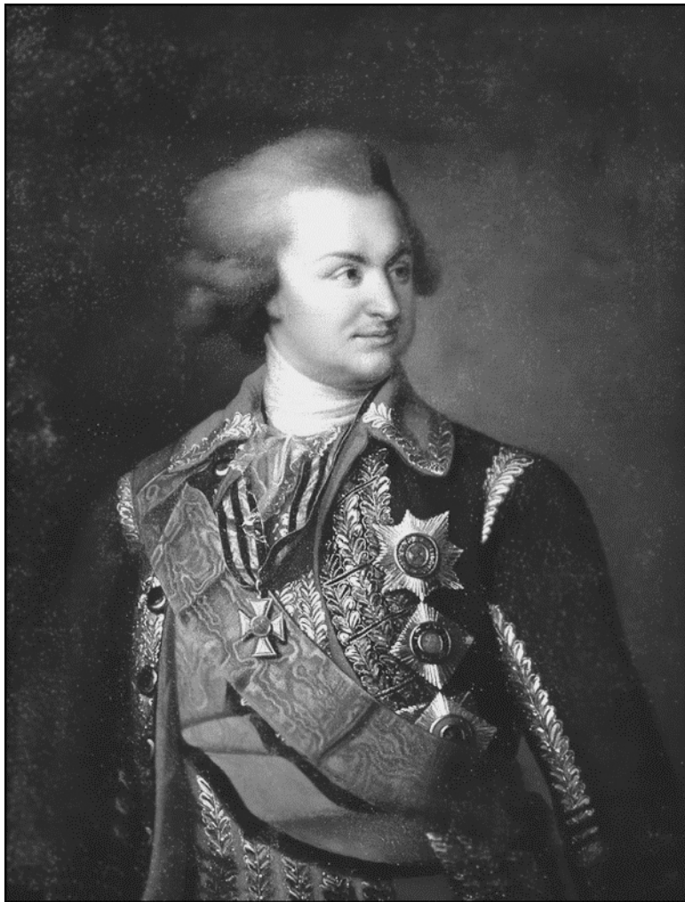
Г. А. Потемкин-Таврический. Неизвестный художник