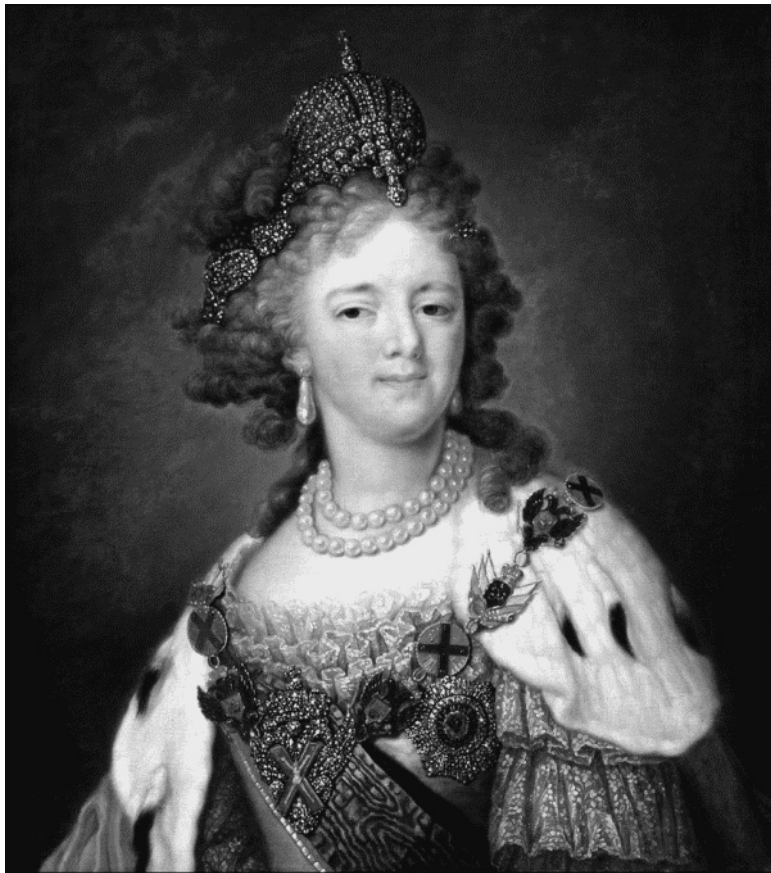
Портрет императрицы Марии Фёдоровны. Художник В. Л. Боровиковский

Она не слышала, как в час ночи, уже 12 марта, в покои