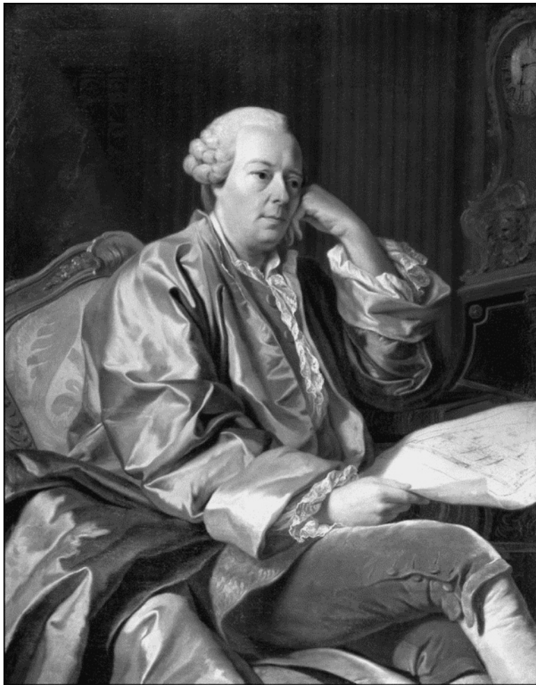
Портрет И. И. Бецкого. Художник А. Рослин