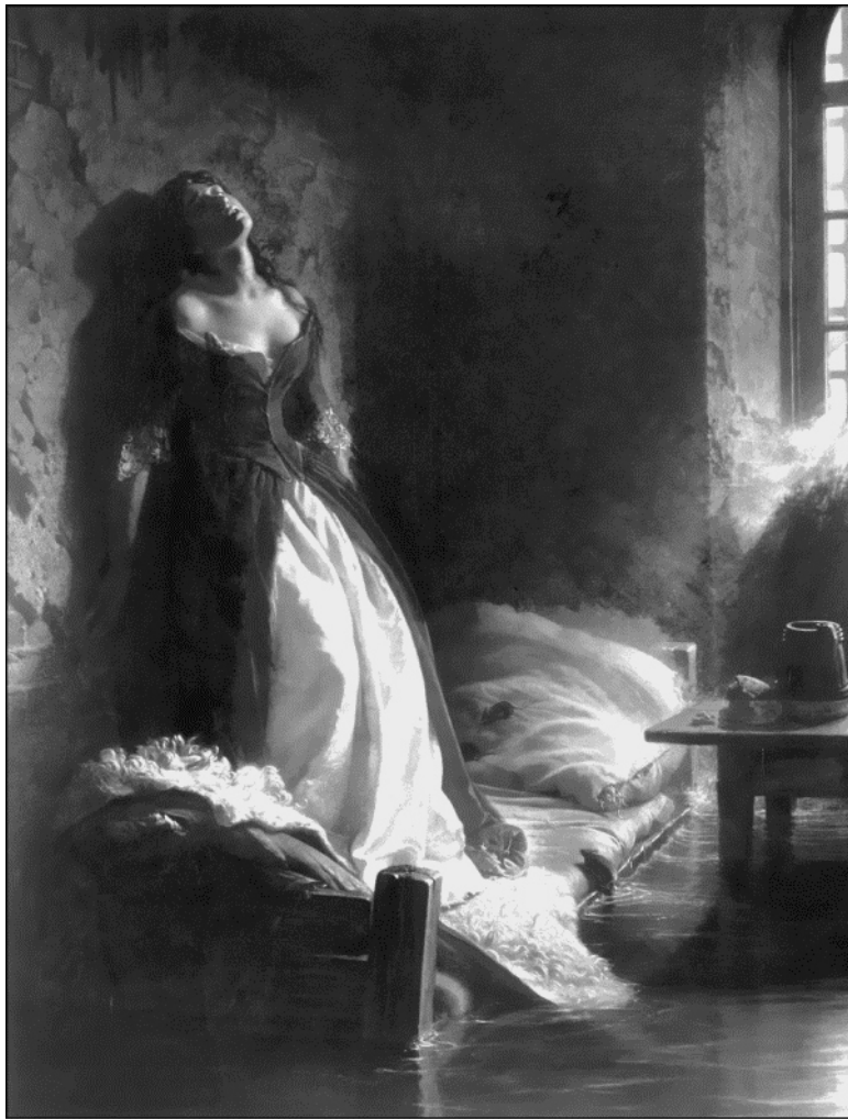
Княжна Тараканова. Художник К. Д. Флавицкий