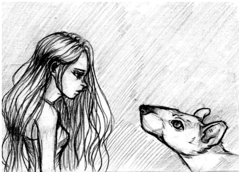
рисунок Лизы Сысоевой

Жизель достала из кармана зеркальце и положила его рядом с птицей.— Они увидят себя, когда начнут грызть птицу и больше не придут к нам никогда.