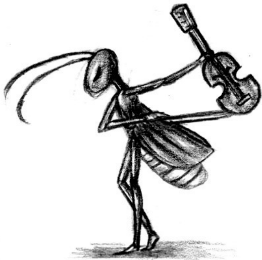
рисунок Лизы Сысоевой

– Понятия не имею.– ответила Жизель. Я жила в орешнике, но был ураган, и вода затопила лес.