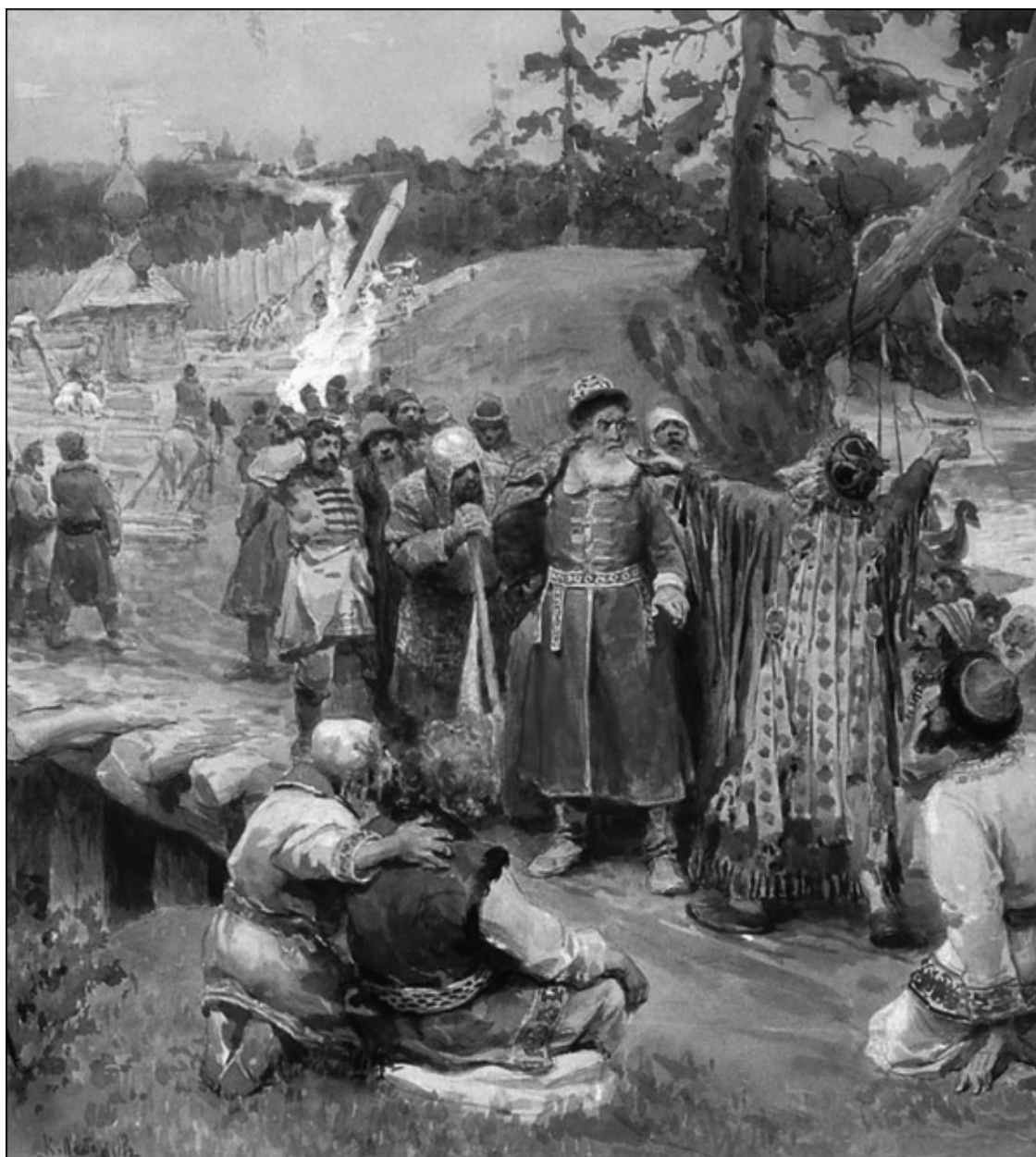
Освоение русскими новых земель. Художник К.В. Лебедев