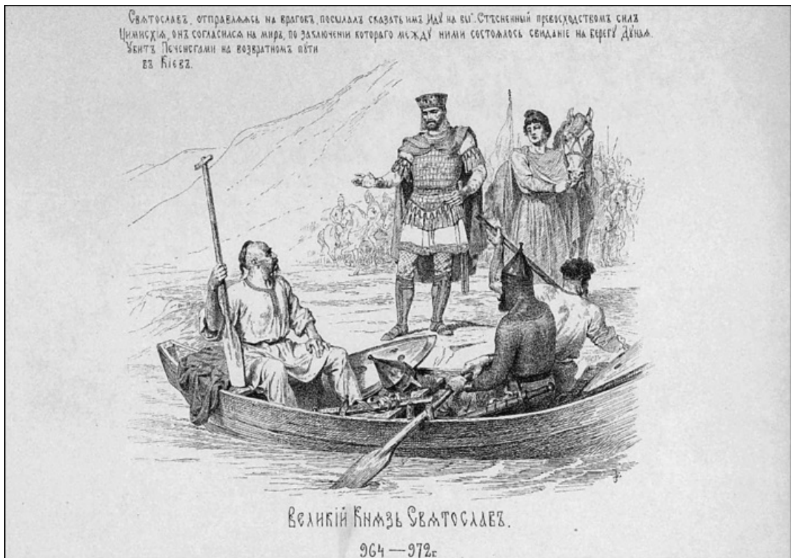
Великий князь Святослав. Художник В.П. Верещагин

От Рюрика до Владимира I7 мы видим удалство воинов и постоянное опустошение ими константинопольских пределов. Добыча и корыстолюбие награждали и обогащали и воинов, и великих князей. Отважные Игори и Святославы умели вселить в душу своих сподвижников решимость – почти невероятную. Кто не знает красноречивых слов любимого воинами вождя – князя Святослава, произнесшего их на поле битвы и в коих резко выражено бесстрашие и честь воинственной доблести: «Не посрадим земли русские! Ляжем здесь костьми: мертвым нет срама! Если победим, то позор нам. Станем крепко!» 8 Этот дух поныне живет в русских. Византийские писатели свидетельствуют, что под крепостью Доростелем 9 герои наши оказывали чудеса храбрости, которая доходила до остервенения.