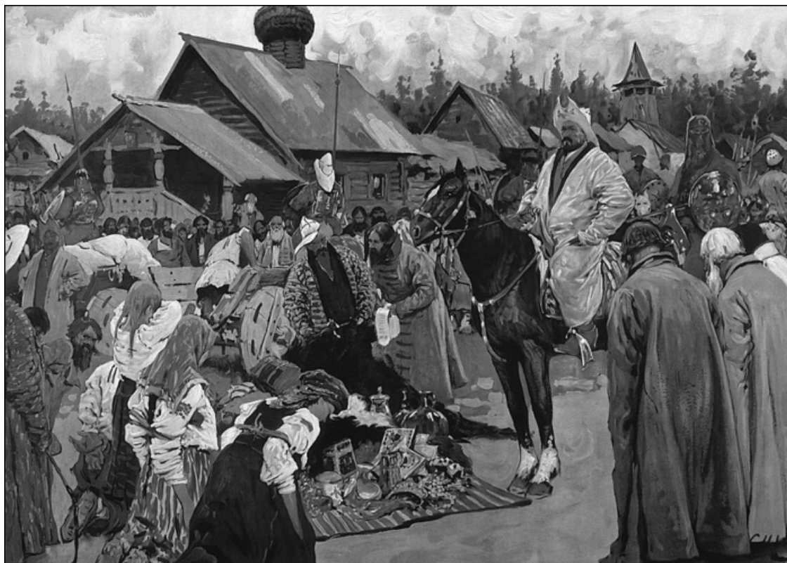
Баскаки. Художник С.В. Иванов

Когда хан отправлял посла в Москву, тогда великий князь встречал его за городскими воротами, как самого царя, и подносил ему чашу кобыльего молока. Князь наблюдал пред ним величайшее почтение, безотчетную покорность и не смел пред ним садиться. Когда посол садился на коня, тогда князь наклонял пред ним свою спину, а тот, став на нее ногами, взлезал на лошадь 23 . Этот обычай прекратился в конце XV в. София, супруга в. к. Иоанна III, убедила его не встречать ордынских послов 24 . Никто не избегал угнетения, и никто не был уверен ни в своей собственности, ни в своей жизни. Богачи лишались имений без всякой вины; матери оплакивали честь дочерей: враги презирали невинность! Часто жены и девицы, защищая свою добродетель, бросались с высоких хором или поражали себя ножами! Часто татары в глазах родителей топтали младенцев конями и смеялись над воплями несчастных; часто в присутствии детей они вырывали внутренность отцов и матерей и сдирали с живых кожу. О, тогда живые завидовали мертвым! Гордые некогда боярыни преклоняли с трепетом свои головы пред повелениями татарских жен; нося прежде золотые ожерелья и шелковые одежды, едва уже прикрывали наготу рубищем; некогда окруженные толпою слуг, они сами сделались рабынями татарок: носили для них воду, мололи хлеб, готовили пищу в дымной избе, в коей закуривали свои нежные, белые лица чернотою неволи; тогда уже никого не различали. Потушали самую честь, которая драгоценна только при благоденствии.