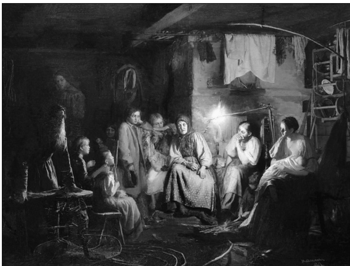
Бабушкины сказки. Художник В.М. Максимов

При собирании мною сведений я встречал бесчисленные противоречия и постоянные исправления, особенно в песнях. Оттого многие из них неполные, сбивчивые или уже сходные с напечатанными, но много достоинства утрачено в наших песнях еще тем, что они напечатаны без объяснения обрядных наших действий. Находятся десятки песенников под названием полных, новых и полнейших, которые большей частью лишены пояснений: при каких случаях поются помещенные в них песни? Какое их назначение, их дух, сила и какой их обряд? Все наши песни слагались по случаю какого-либо печального или радостного события, которое гремело в разгуле веселия, на свадьбе, в игре, забаве и хороводах. Ни одна из них не составлена произвольно, без причины. Песни без изъяснения обрядных их действий скучны и утомительны. Правда, они любопытны, занимательны и поучительны, зато потеряно навсегда действительное их значение. Можно догадываться и выводить о них заключения, но можно ошибаться и выводить ложные заключения. Этими примерами служат все сборники песен. Конечно, они дорогой запас – должно радоваться и благодарить любителей за собрание, но нельзя не сознаться, что этот дорогой запас подобен алмазам, не имеющим блеска и не могущим получить своего сияния без руки художника. Если в настоящее время не объяснятся песни обрядными своими назначениями, то и в будущем останутся необъясненными: примером тому собрание древних стихотворений Кириши Данилова и др.