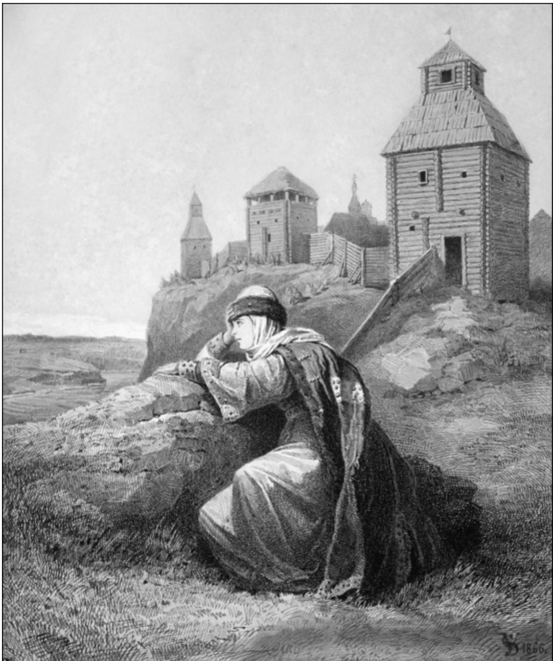
Плач Ярославны. Художник В.Г. Шварц

вспоминая про времена первых князей своих!» Супруга Ярослава плачет, говоря: «Полечу незнаемой кукушкой по Дунаю, омочу шелковой (бебрянь) рукав в реке Каяле и утру кровавые раны на изрубленном теле моего друга». Супруга пленного Игоря проливает слезы в Путивле, смотря с городской стены в чистое поле: «О, ветер, ветер! Для чего ты веешь! К чему мечешь ханские стрелы на воинов моего друга? Разве тебе мало веять на горах под облаками, носить корабли на синем море? К чему мое веселие развеваешь? О, славный Днепр! Ты пробил каменные горы в земле половецкой, носил на себе Святославовы ладии к стану Кобякова; принеси ж ко мне моего милого, чтобы я не посылала к нему в море утренних слез моих. О, светлое и пресветлое солнце! Ты для всех теплое и красное: для чего ж падаешь горячими лучами на воинов моего милого, палишь их в безводной пустыне и угнетаешь печалью?»