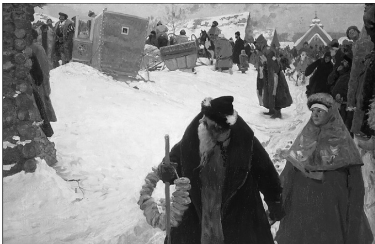
Приезд иностранцев. XVII в. Художник С.В. Иванов

Изложить быт народа, сколько можно с должной верно- стью, нет возможности одному человеку: это труд многих. Я старался представить его, сколько мог по моим силам, и отнюдь не думаю, чтобы мой труд не был изменен даже в самое короткое время, и надобно желать, чтобы любители отечественного дополнили его новыми, еще <более> богаты- ми источниками. Если бы местные жители собирали тузем- ные сведения и делали их доступными, то можно бы достиг- нуть общего описания русского быта. Только при содействии