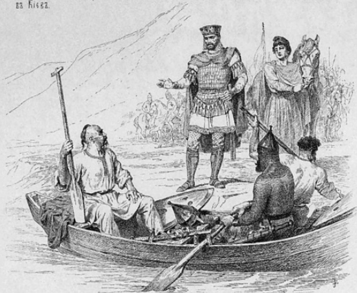
Великій Князь Святославъ.

Святославъ отправляясь на воеванія, послалъ сказать имъ Иду на вы. Стреленный преслѣдованіи силъ Циниски, онъ согласился на миръ, по заключеніи котораго между ними состоялось селаніе на берегъ Днѣпа Убитъ Печенегами на возвратномъ пути въ 962.