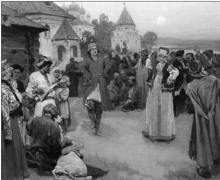
Пляска. Художник К.В. Лебедев

Древние народные обычаи мало изменялись до конца XVII в. Хотя мы познакомились с винами иноземными, однако русские яства и хлебосольство, радушие и роскошные одежды еще напоминали и тогда старинную самобытность. Все любило свое собственное, им жило и веселилось, и это чувство переходило от потомства к потомству как завет самосохранения.