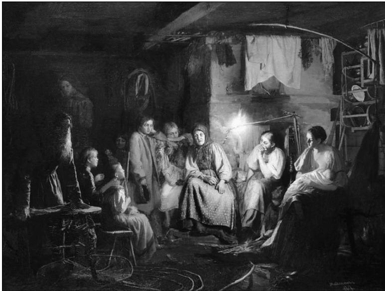
Бабушкины сказки. Художник В.М. Максимов

за собрание, но нельзя не сознаться, что этот дорогой запас подобен алмазам, не имеющим блеска и не могущим получить своего сияния без руки художника. Если в настоящее время не объяснятся песни обрядными своими назначениями, то и в будущем останутся необъясненными: примером тому собрание древних стихотворений Кирши Данилова и др.