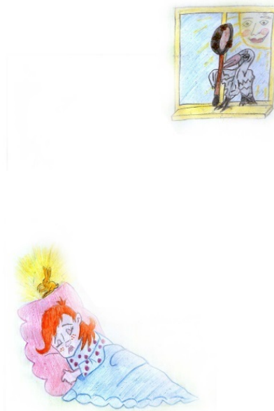
Полина Мещер, 6 лет