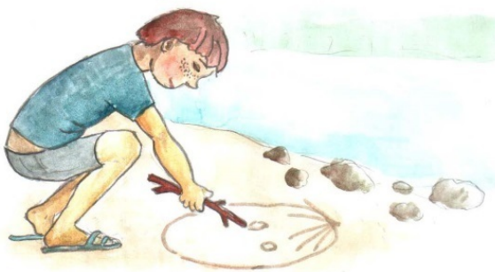
Никита Верхоланцев, 10 лет