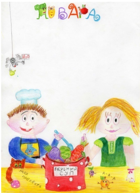
Виталий Зварич, 10 лет