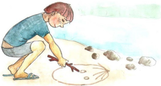
Никита Верхованцев, 10 лет