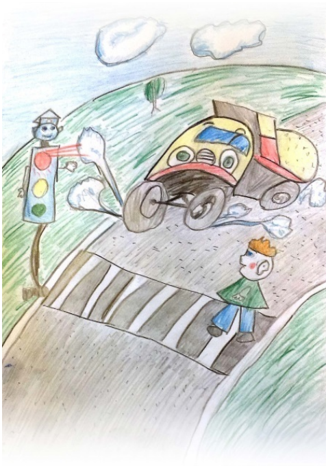
Лев Яровицын, 10 лет