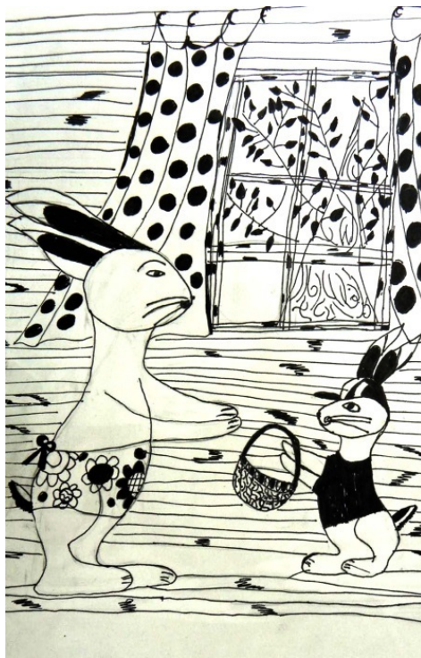
Художник: Дарья Ругнова, 9 лет