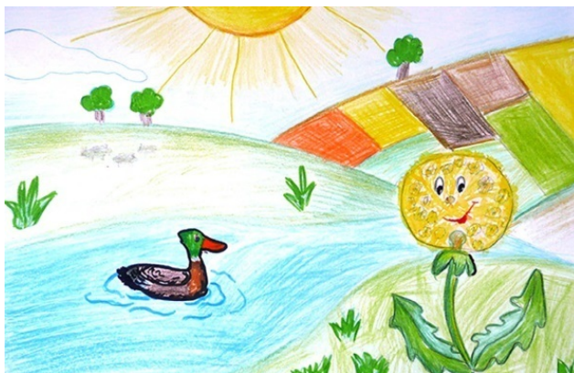
Художник: Дмитрий Глазунов

Чик ощущал новое, незнакомое ему чувство счастья. Ветер, разделяя его радость, закружился вокруг Чика, и десятки семян-парашютиков взлетели в воздух, словно фейерверк. Белоснежные хохолки разлетались в разные стороны и расселялись вокруг, обживая пустые места, чтобы все семена Радости, выращенные Чиком, проросли.