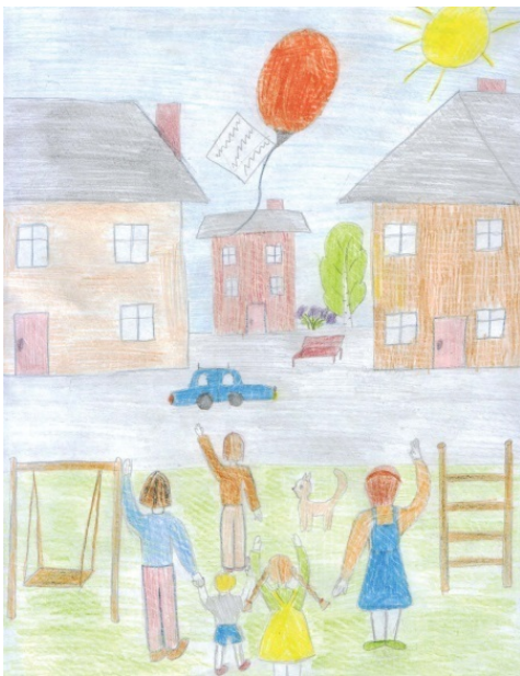
Художник: Анна Можаяева, 9 лет