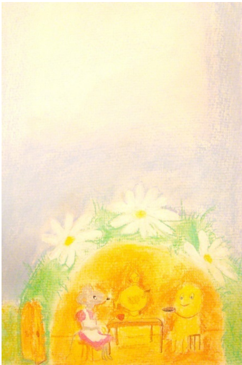
Художник: Татьяна Осколкова, 11 лет