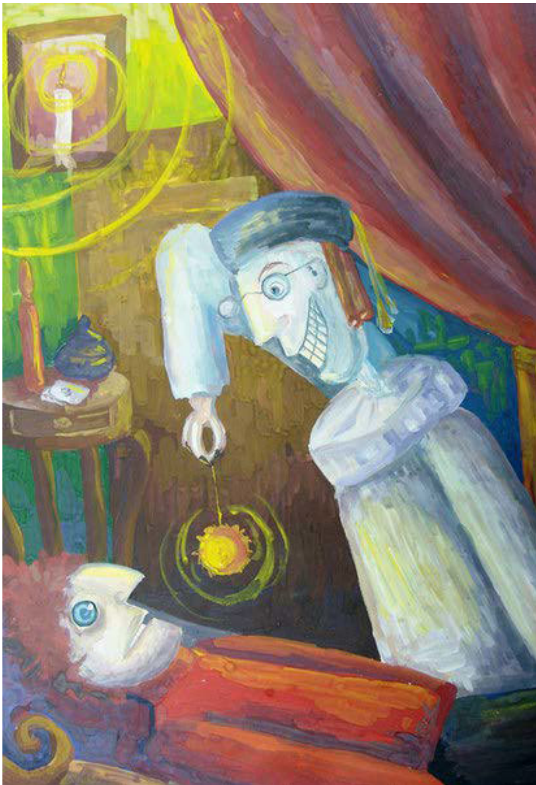
Цекало Света, 14 лет