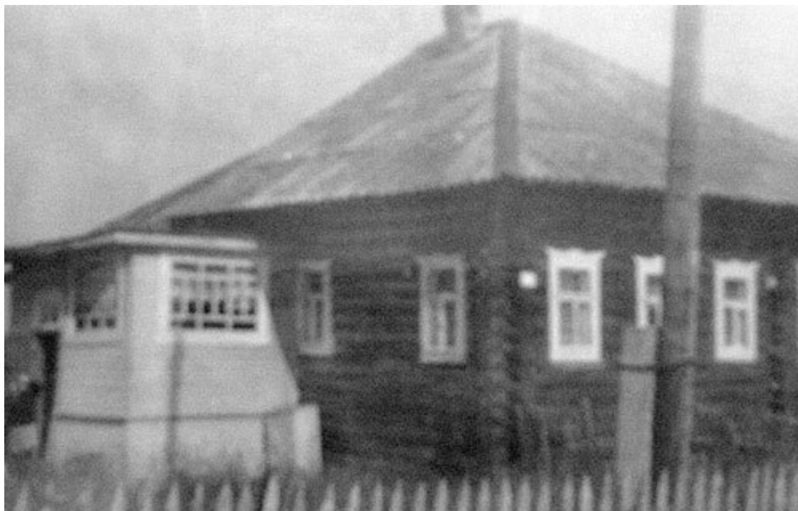
Дом Коноваловых на станции Морженга