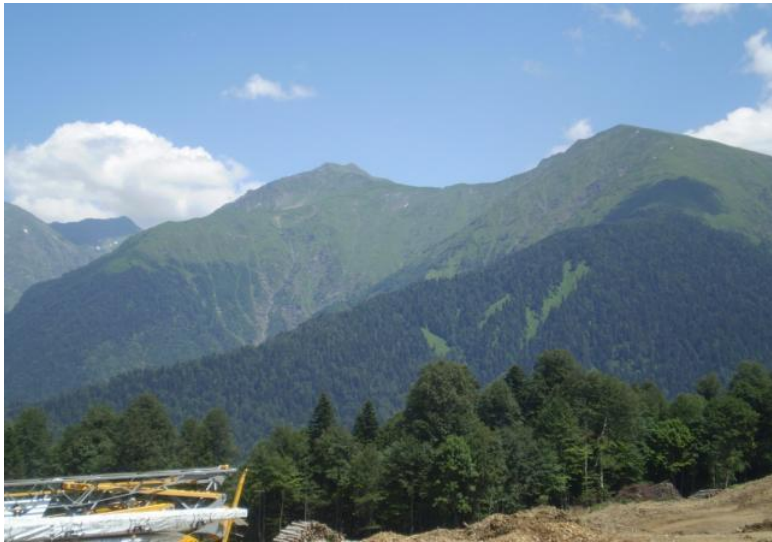
Горы, вид с коттеджей.