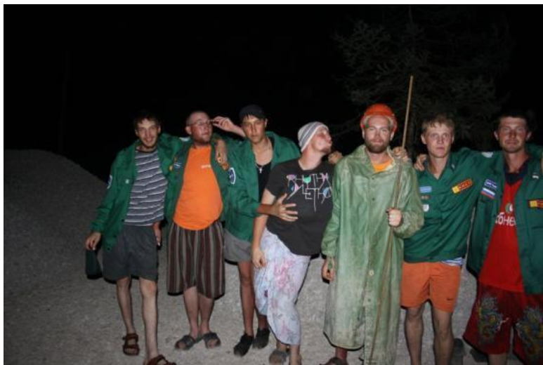
Дед мороз, Снегурочка и бойцы.