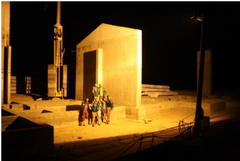
Ночью на коттеджах.