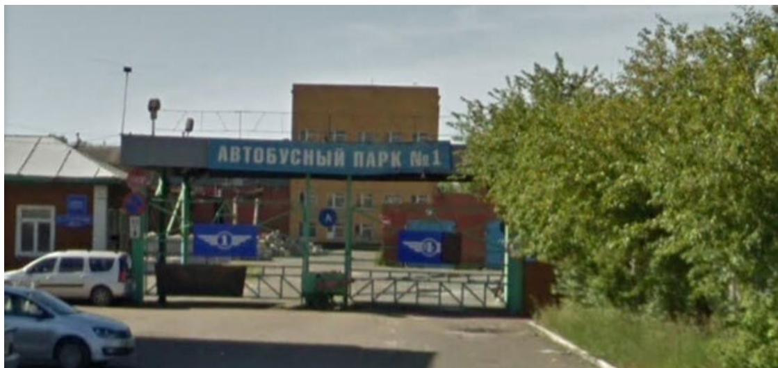
Автобусный парк № 1

Хотя пришёл я в ПАТП совсем без опыта. Не то что водить, просто парковать большую машину в узкий бокс, где стоят около полусотни автобусов, было сложно и страшно.