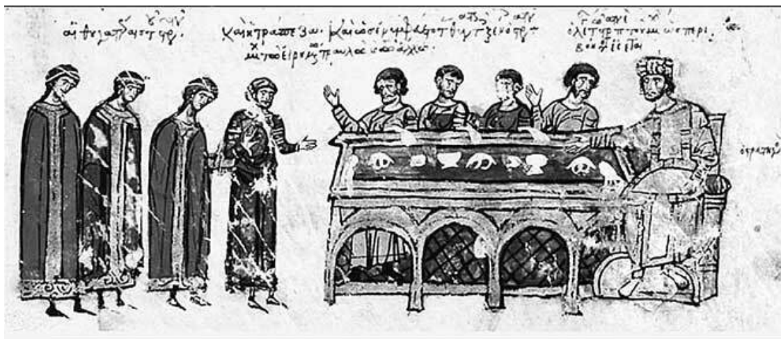
Илл. 1.1. Военачальник предлагает своих дочерей в жены гостям во время пира, миниатюра Мадридского Скилицы

«Кто в гневе поднял топор на свою супругу, – убийца» ( Василий Великий . Письма 188, 8).