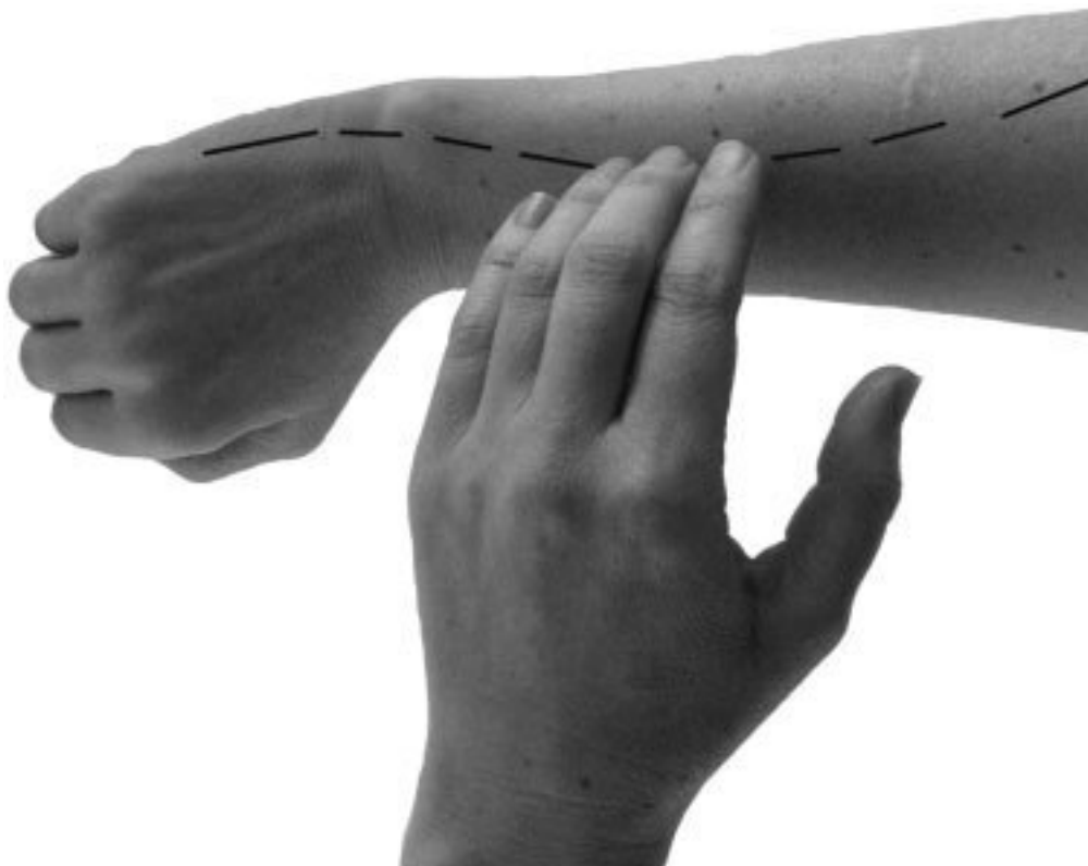
Фото 3, г

Воздействовать на меридиан можно посредством точечного надавливания, нанесения ударов подушечками пальцев по всему ходу меридиана (фото 3, г) или внутренней поверхностью нескольких пальцев. Такая техника удобна при работе с ножными и ручными меридианами, см. фото 3, д. В отдельных случаях применяются удары открытой ладонью и кулаком, например, при быстром простукивании меридианов печени и желчного пузыря. Такие техники обычно используются в Японии, мы обговорим их непосредственно перед началом работы.