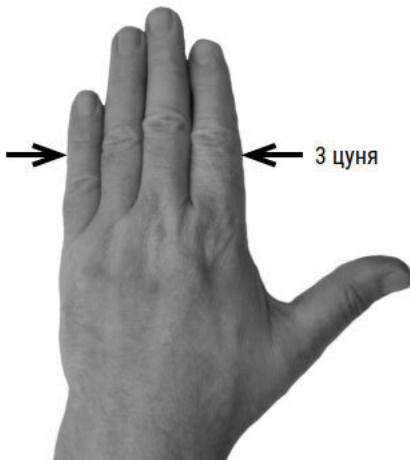
Фото 3, б