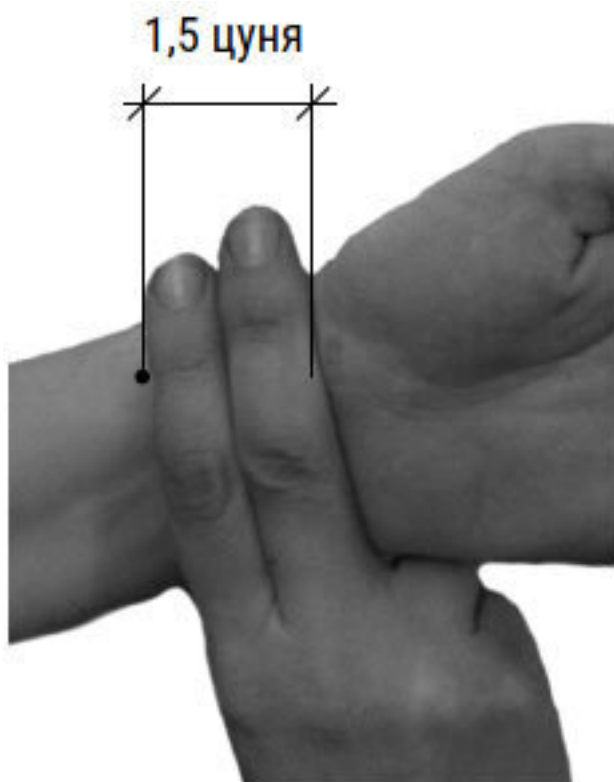
Фото 3, в