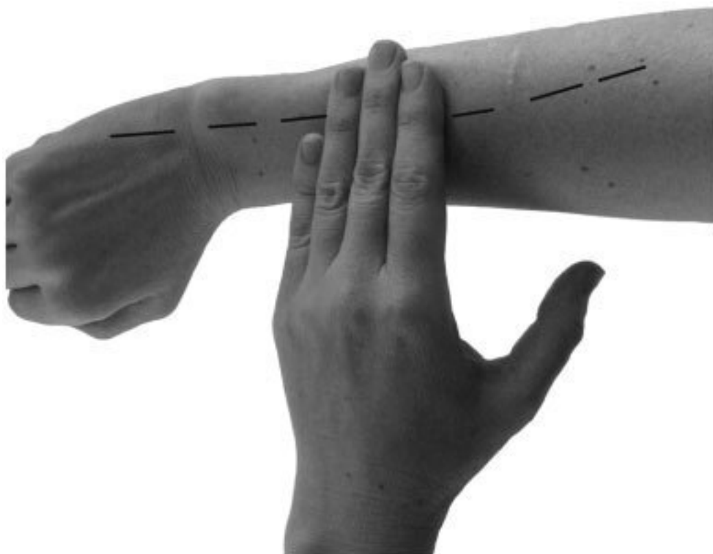
Фото 3, д

В активные точки меридианов можно втирать согревающие составы, о которых мы поговорим ниже.