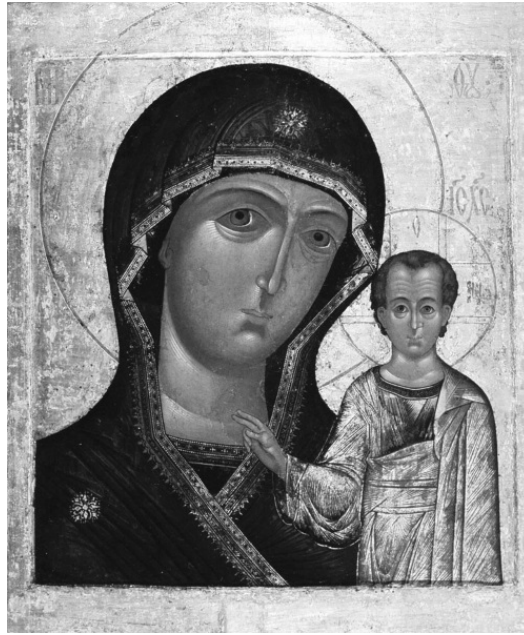
Казанская икона Божьей Матери

Об этом мало кто знает, но в годы Великой Отечественной войны правительство СССР словно бы забыло о том, что социалистический строй антирелигиозен. Ещё в 1930-е с церковью снимали оставшиеся кресты, а в 1940-е никто не препятствовал богослужениям. Более того, в первую военную зиму, когда немецкие войска почти прорвались к Москве, по городу и окрестностям поползли слухи. Говорили, что сам Сталин приказал в 1941 году отслужить молебен у иконы Казанской Божьей Матери и сразу после этого грянули холода, которые остановили немцев на подступах к Москве. Говорили, что «отцу народов» подсказала так сделать святая Матрона.