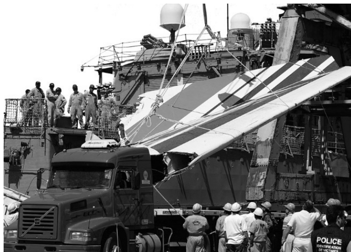
Крушение рейса 447 Air France