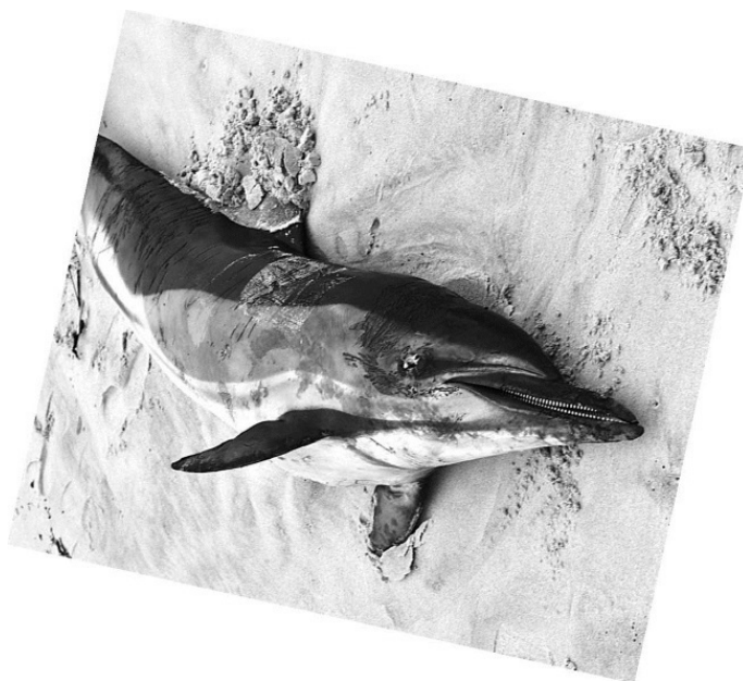
Массовое самоубийство дельфинов. Новая Зеландия, 2009 г.

Животные способны предчувствовать надвигающуюся опасность, и об этом человек знал с древних времен. Например, если моряки замечали, что крысы покидают корабль перед отплытием, это считается дурным знаком. Корабль, покинутый грызунами, непременно попадал в шторм или натыкался на рифы, а в военное время – подвергался торпедным атакам.