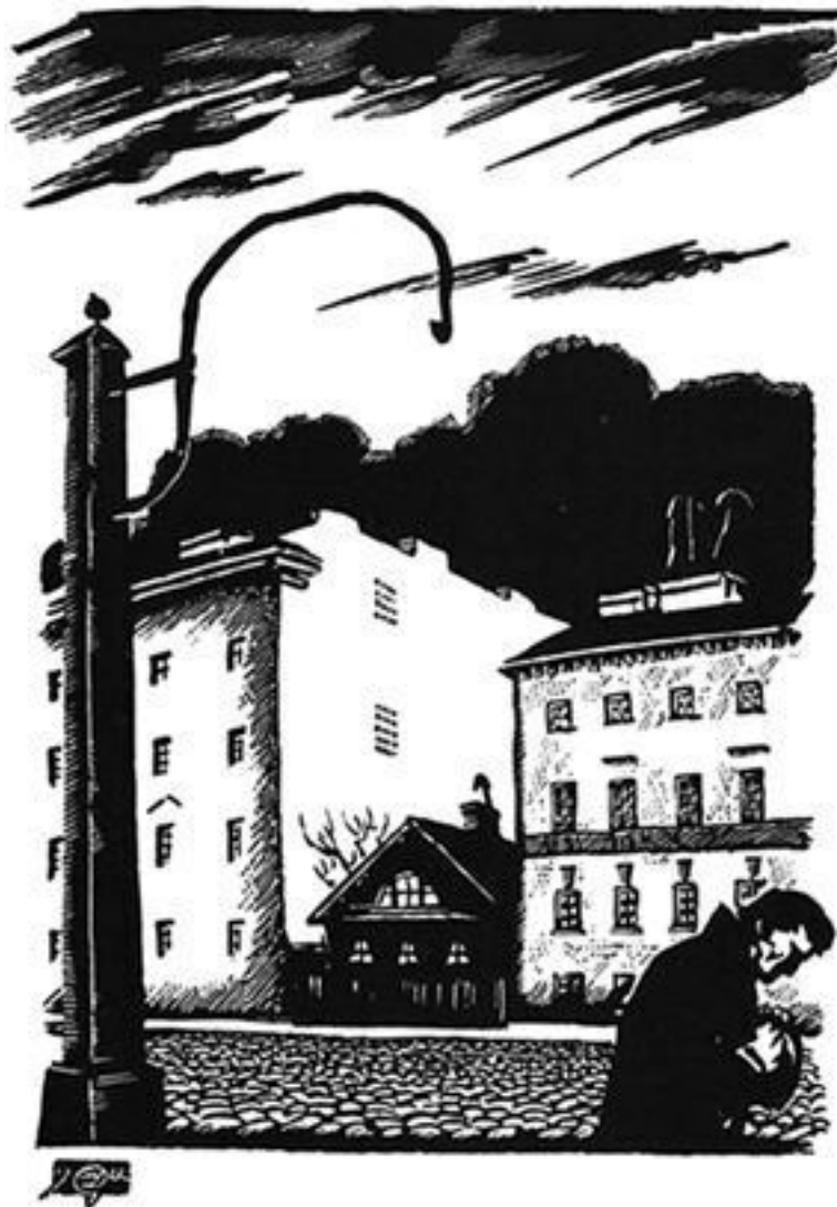
М.В. Добужинский. Иллюстрация к повести Ф.М. Достоевского «Белые ночи». 1922 г.