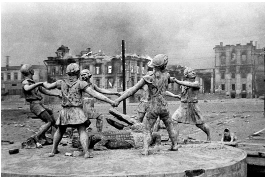
Разрушенный памятник играющим детям на вокзальной площади Сталинграда

Из истории хорошо известно о Нормандии-Неман – французской эскадрилье, воевавшей вместе с советскими летчиками. Но в то же время Франция была основным поставщиком двигателей, запасных частей, электроники для авиационной промышленности Германии, а на французских автомобилях фашисты колесили по всем завоеванным территориям. Десятки тысяч машин с заводов Франции были переброшены во фронтовые зоны, они доставляли немецких солдат под Москву, под Сталинград... Могла ли Германия вести войну против Советского Союза, если бы не такая помощь?!