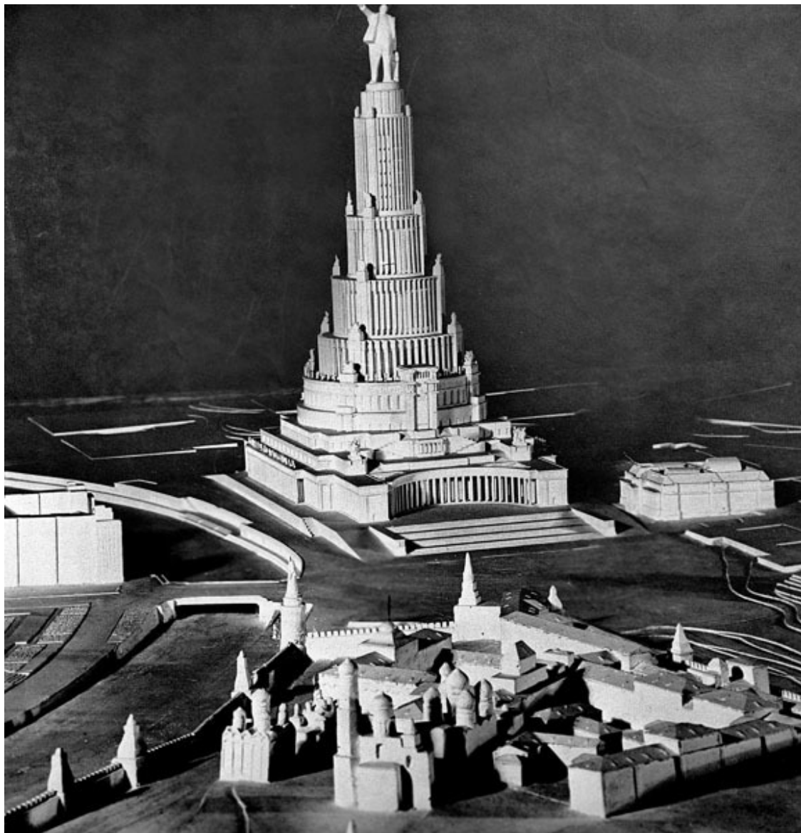
План Дворца Советов

За ходом конкурса внимательно следит Сталин. Будучи на отдыхе в Сочи, он отправляет в Москву письмо следующего содержания: