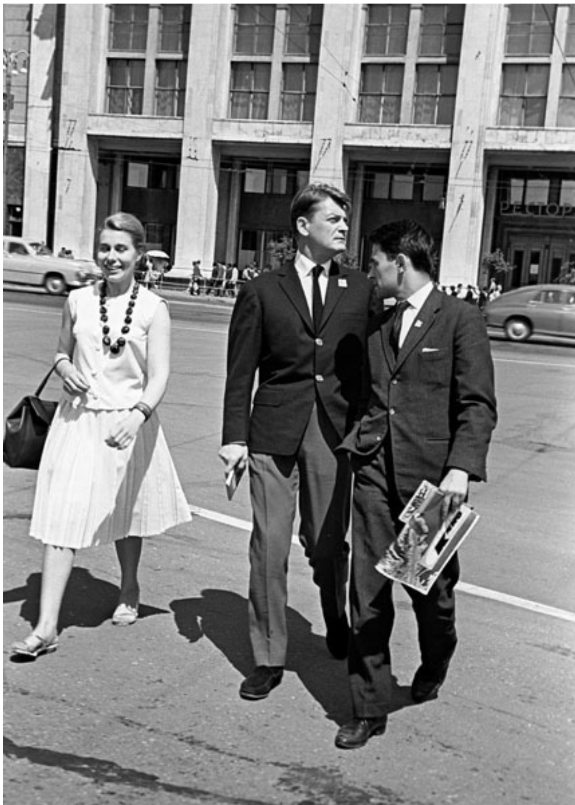
Жан Марэ (в центре) на Манежной площади

Что удивительно, итогами войны с выгодой для себя воспользовалась даже Франция. В ее состав вошли немецкие земли Эльзас и Лотарингия, которыми она по сей день владеет. И это при том, что почти всю Вторую мировую Франция работала на гитлеровскую армию, но официально находилась с 1939 года в состоянии войны с Германией и входила в антигитлеровскую коалицию! Правда, никакой войны она не вела. Еще в 1940-м Франция попросила нем-