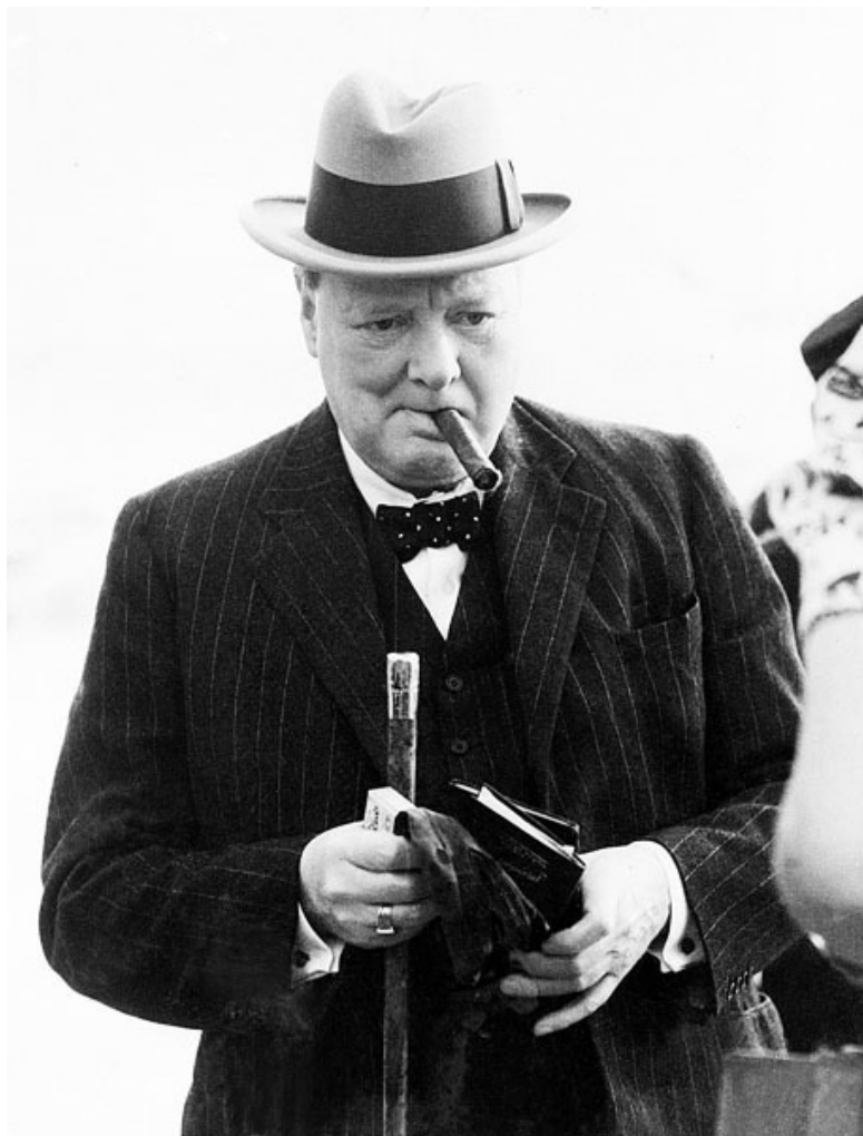
Сэр Уинстон Леонард Спенсер-Черчилль – британский