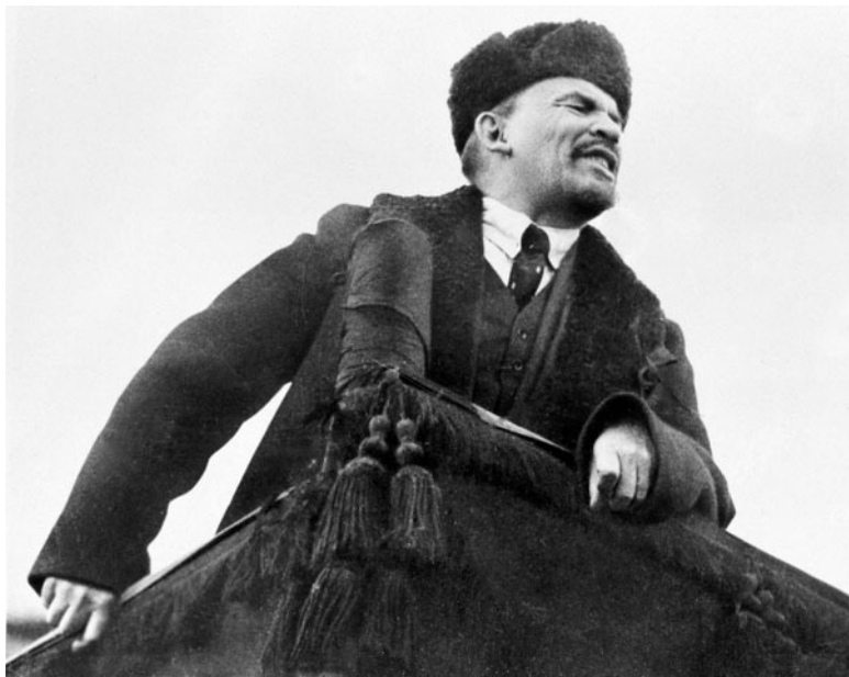
Владимир Ильич Ленин

да он понял, что Временное правительство теряет популярность и авторитет, что есть возможность завоевать Советы. Но он не только понял, но и воспользовался этим моментом.