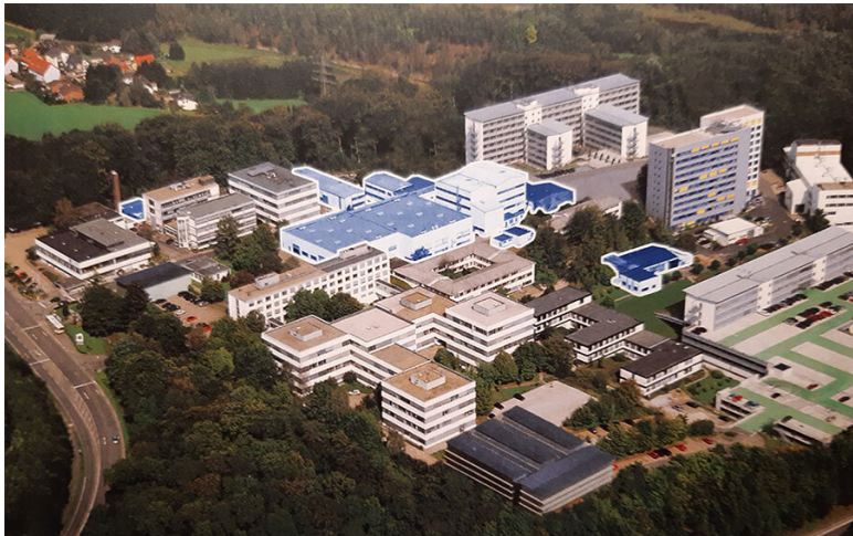
Технологический парк в Бергии Гладбахе