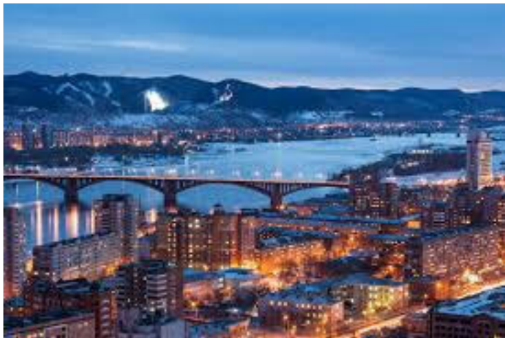
Вид на Енисей, Красноярск

Я вспоминаю юность, Красноярск... Мне всегда почему-то хотелось стать конструктором, не могу это объяснить, но хорошо помню это ещё со школы. Удивительно, что иногда мечты сбываются. В то время мне казалось, что задумать