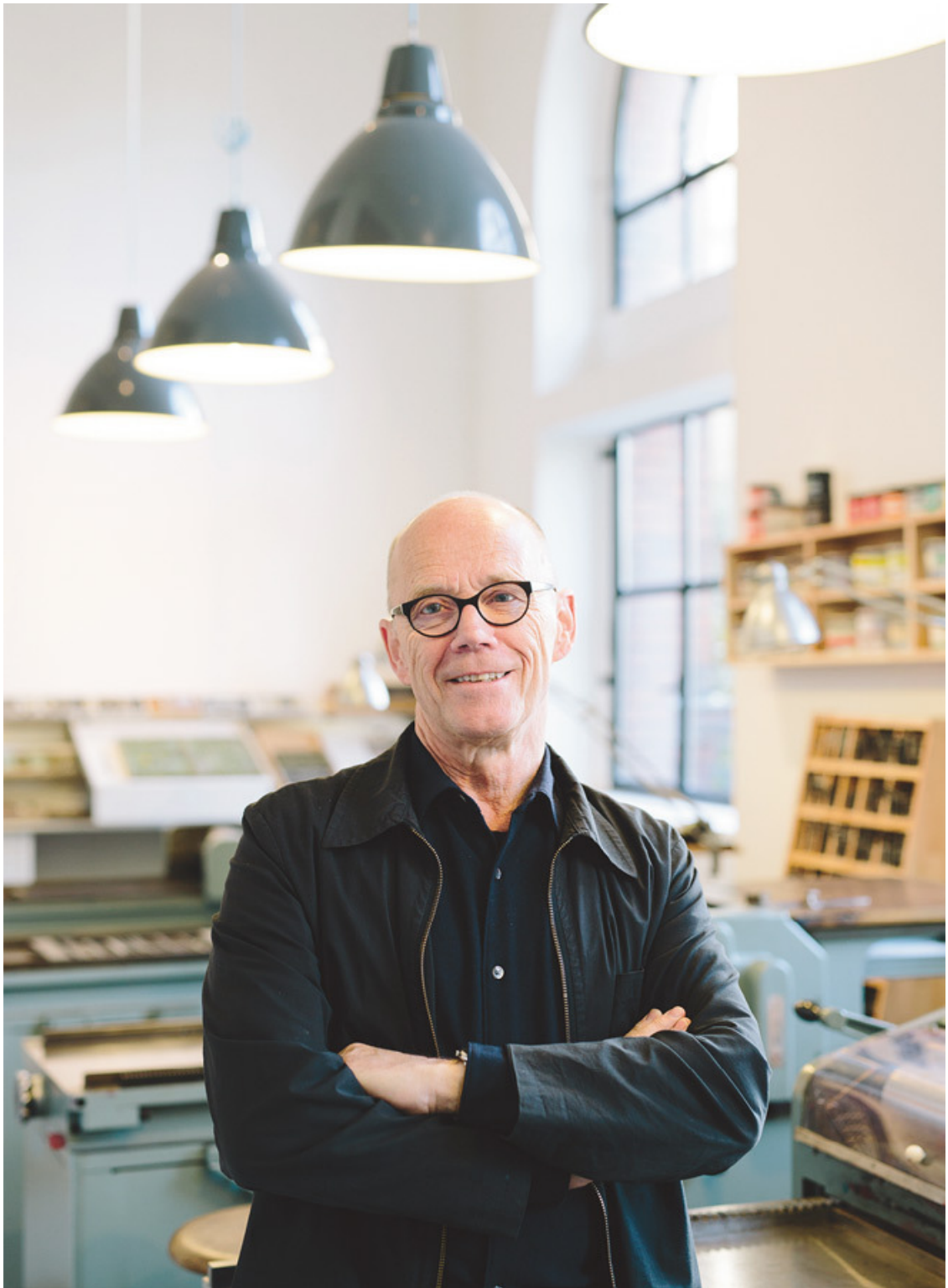
Эрик Шпикерманн в своей мастерской galerie p98a.

Кстати, я не могла согласиться с Эриком в том, что именно он не художник. Ведь тот факт, что художники получили в обществе статус аутсайдеров, начали искать свою нишу или посвящать себя искусству ради искусства, – сравнительно молодое явление. Во все времена скульпторы, живописцы или архитекторы были талантливыми ремесленниками – в этом слове нет негативной коннотации – и решали, выражаясь языком Эрика, чужие проблемы. Причём