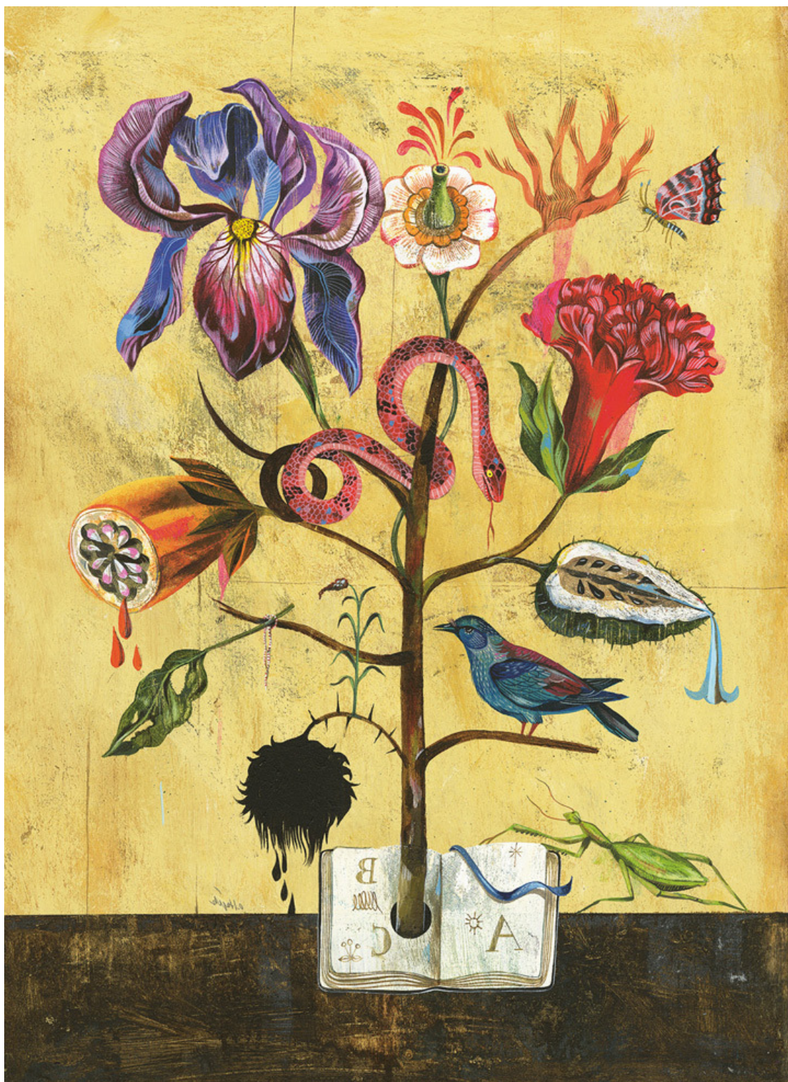
Работа Олафа Хайека «Цветы разума», 30x40 см, акрил по дереву, 2011