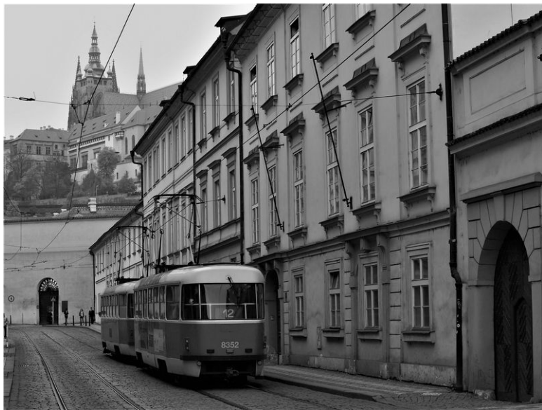
Трамвай у калитки в Вальдштейнские сады

ностью, кто теперь знает. В результате и фармацевт, и помощник были заключены под стражу и умерли под пытками.