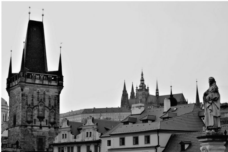
Град и крѣпости Мала Страны