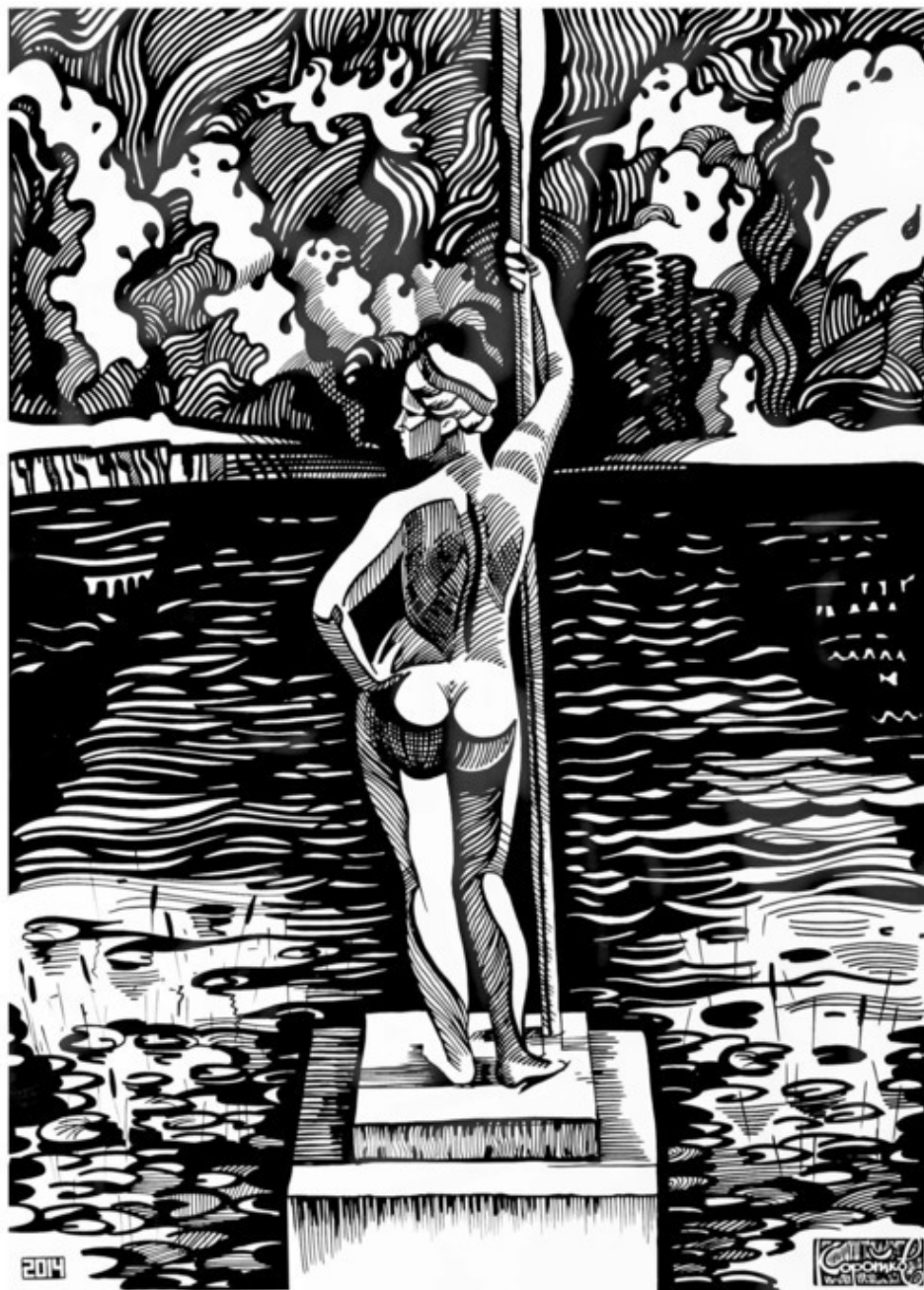
Девушка с веслом. Н. Коротков.