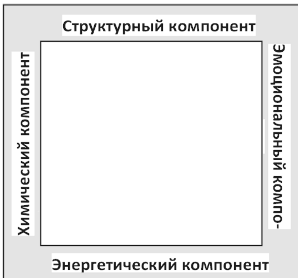
Рис. 2. «Квадрат здоровья».

Почему это происходит? Эмоции выражаются определенной позой тела, тоном голоса и мимикой, т. е. они, большей частью, невербальны. По разным оценкам, на невербальную часть эмоционального посыла приходится от 80 до 98 % информации, а на слова – от 20 до 2 %. Если мы оставим только тело – наш структурный компонент – то тело больше чем на 60 % выдаёт эмоциональную реакцию. Таким образом, если у человека имеется какая-либо хроническая эмоция, то тело постоянно будет находиться в одной и той же позе. И это приводит к тому, что какие-то части тела или органы намного хуже дренируются: меньше механического движения, ограничение дыхания в этой части, либо лимфатический застой – для тела это символ воспаления. Таким образом, эмоциональная фиксация приводит к эмоциональной дисфункции, устойчивому эмоциональному нарушению.