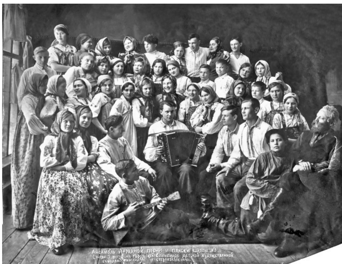
Ансамбль песни и пляски, школы № 3 1940 год.