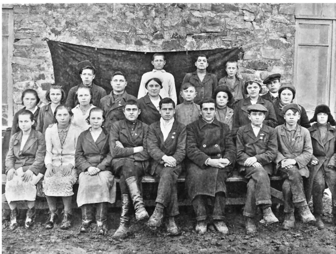
Ученики и учителя школы пос. Карпово-Крепинское в 1937–1938 годах