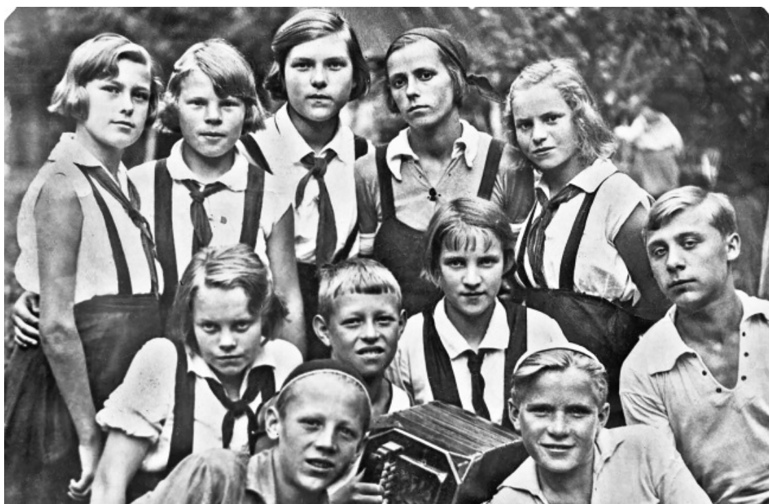
Пионерская агитбригада 30-е годы.