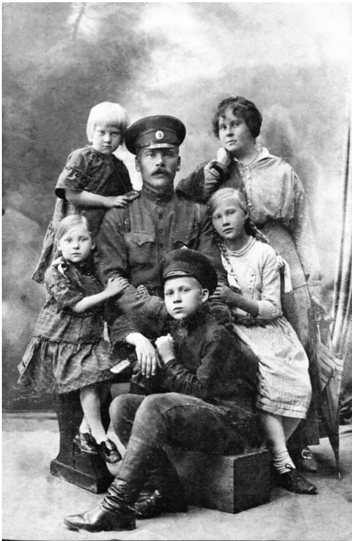
Семья Голиковых. 1914 год