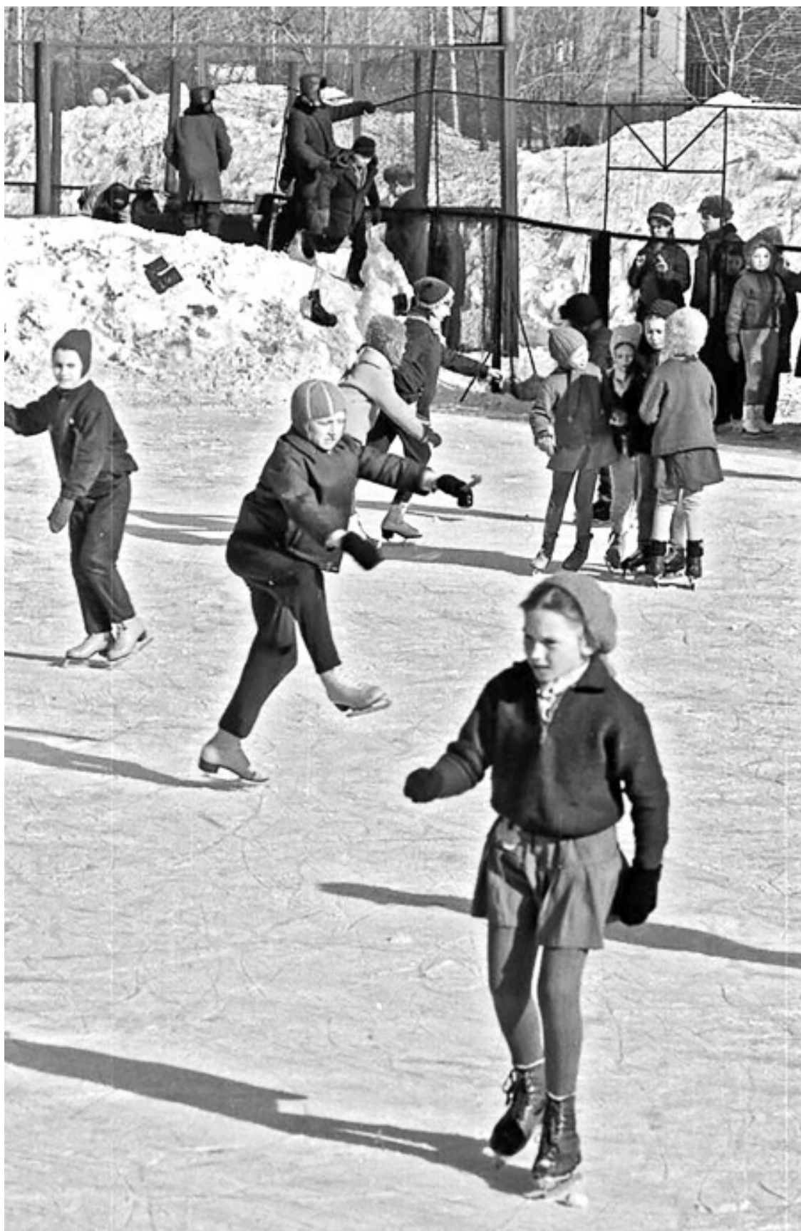
Занятия юных фигуристов на катке