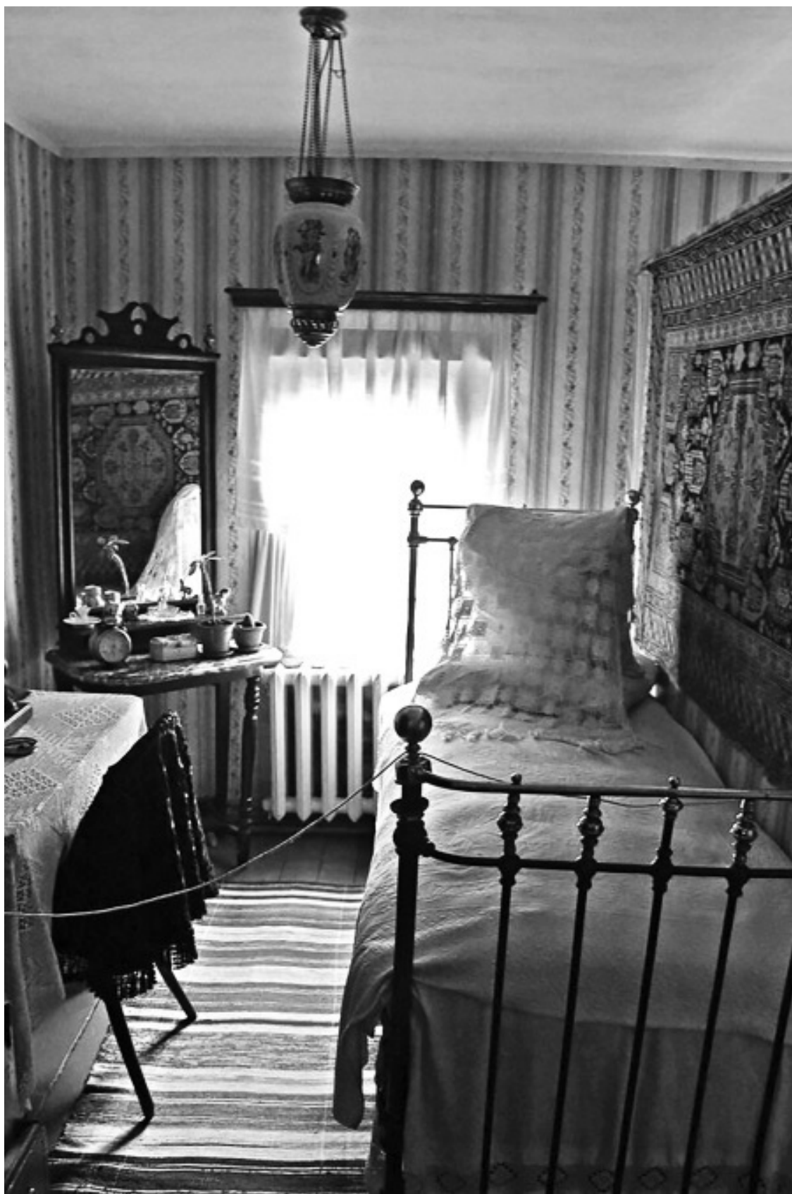
Комната родителей Аркадия Голикова. Мемориально-бытовой дом-музей А.П. Гайдара