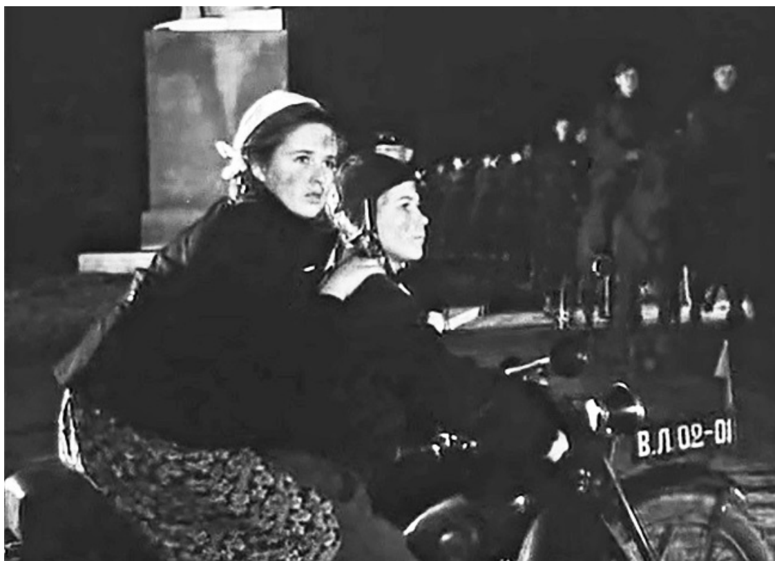
Кадр из фильма «Тимур и его команда». 1940 год