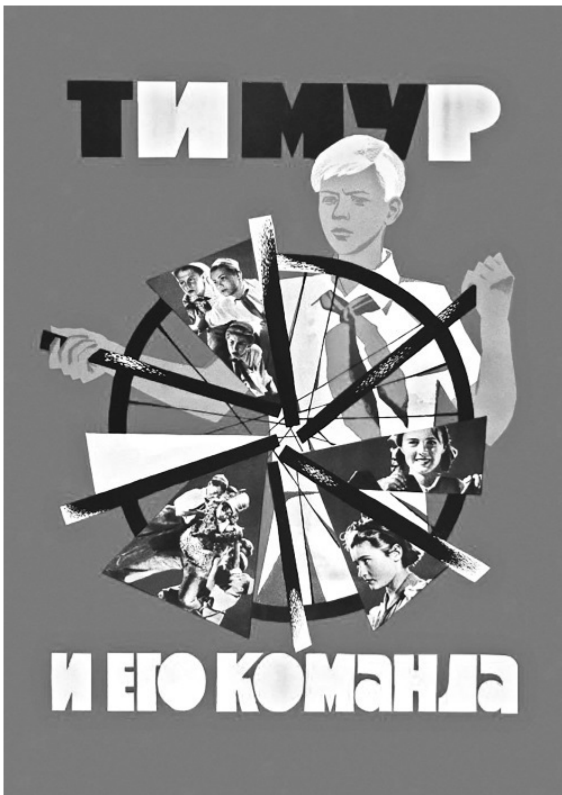
Афиша фильма «Тимур и его команда». 1940 год