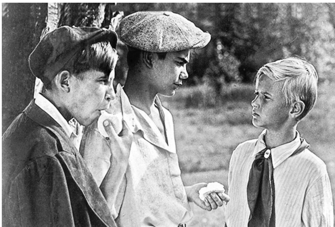
Кадр из фильма «Тимур и его команда». 1940 год