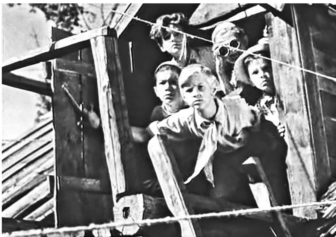
Кадр из фильма «Тимур и его команда». 1940 год