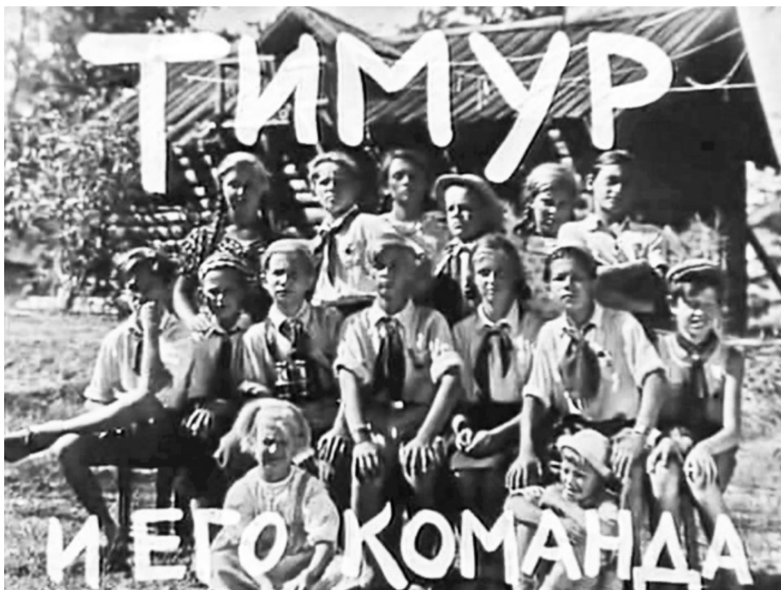
Кадр из фильма «Тимур и его команда». 1940 год