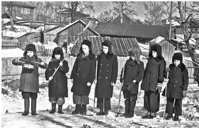
Дети зимой на улице в деревне