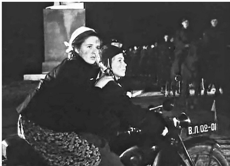
Кадр из фильма «Тимур и его команда». 1940 год