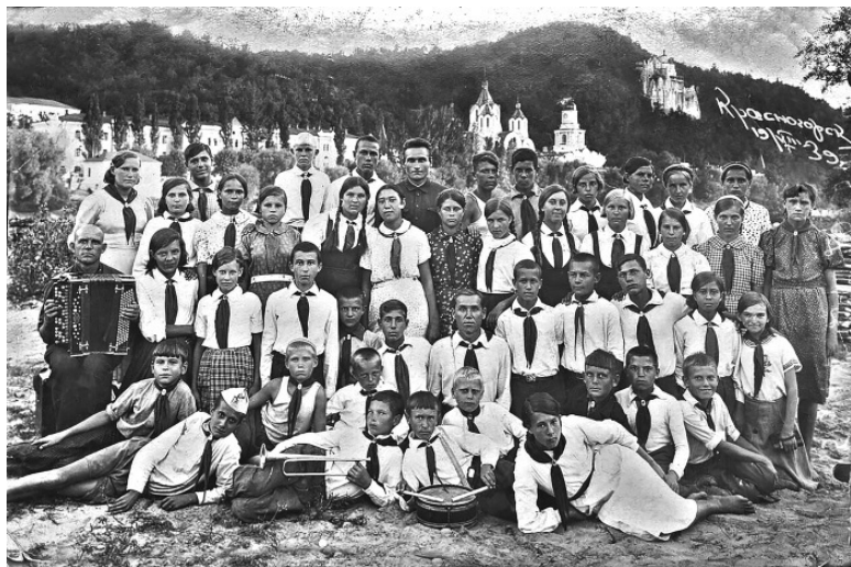
Отряд пионеров. Красногорск. 1939 год