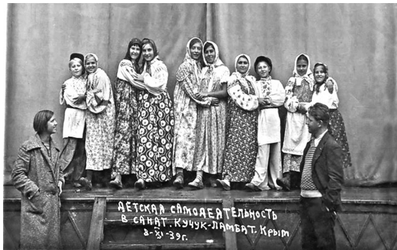
Детская самодеятельность в санатории “Кучук – Ламбат”, Крым. 1939 год.