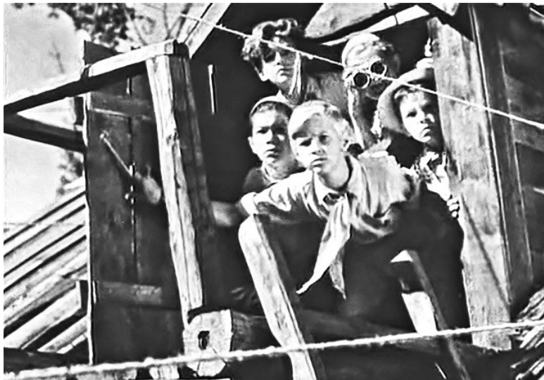
Кадр из фильма «Тимур и его команда». 1940 год