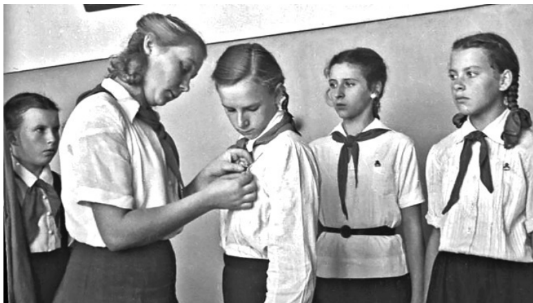
Прием в пионеры. 1940 год