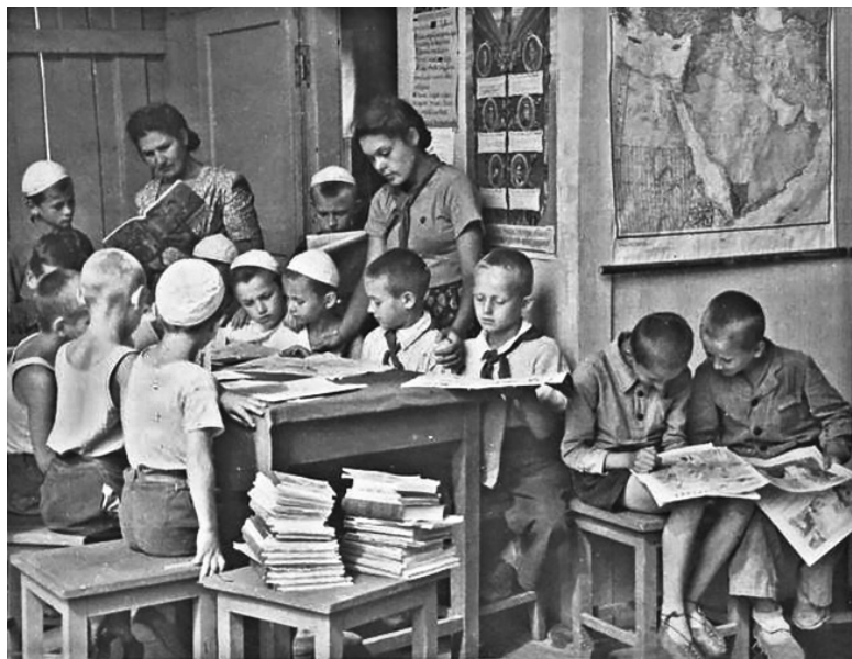
Пионеры в библиотеке