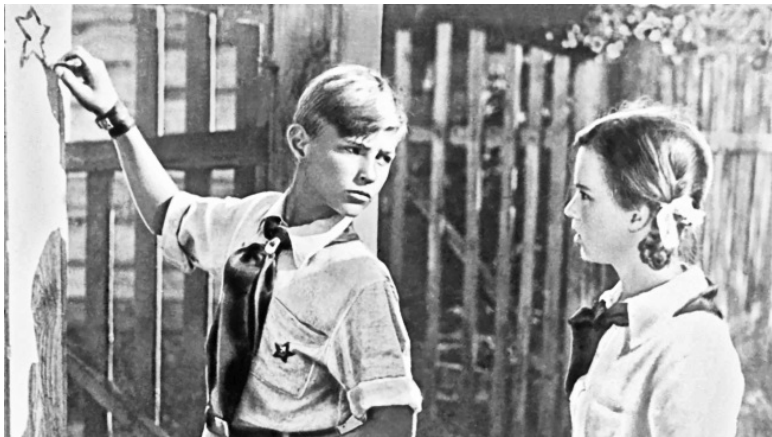
Кадр из фильма «Тимур и его команда». 1940 год