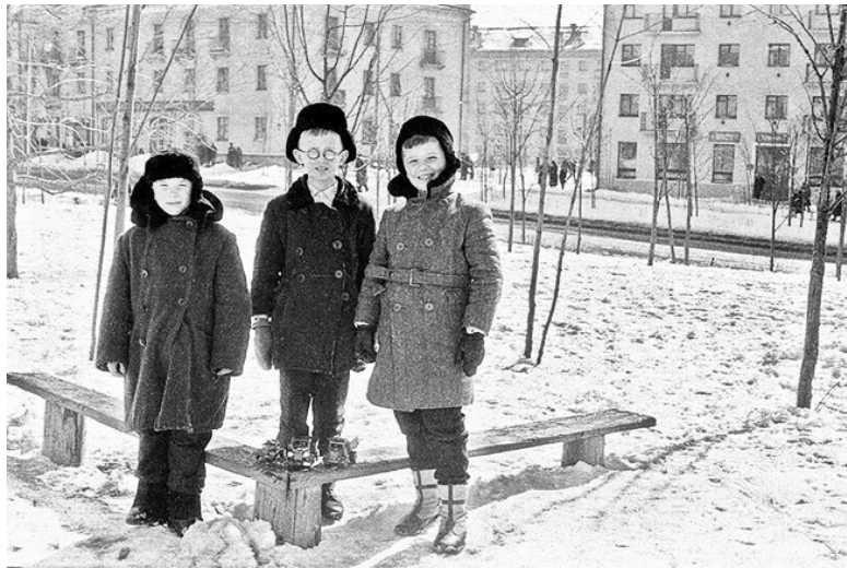
Дети во дворе