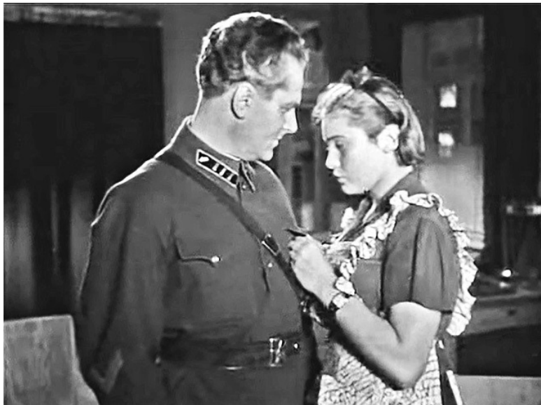
Кадр из фильма «Тимур и его команда». 1940 год