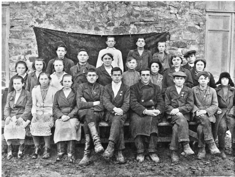
Ученики и учителя школы пос. Карново-Крепинское в 1937–1938 годах