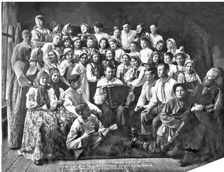
АНСАМБЛЬ НАРОДНОЙ ПЕСНИ И ПЛЯСКИ ШКОЛЫ №3 СЛУЖИТЕЛИ ГОРОДСКОЙ ОЛИМПИАДЫ ДЕТЕЙ ХУДОЖЕСТВЕННОЙ САМОДЕЯТЕЛЬНОСТИ

Ансамбль песни и пляски, школы № 3 1940 год.