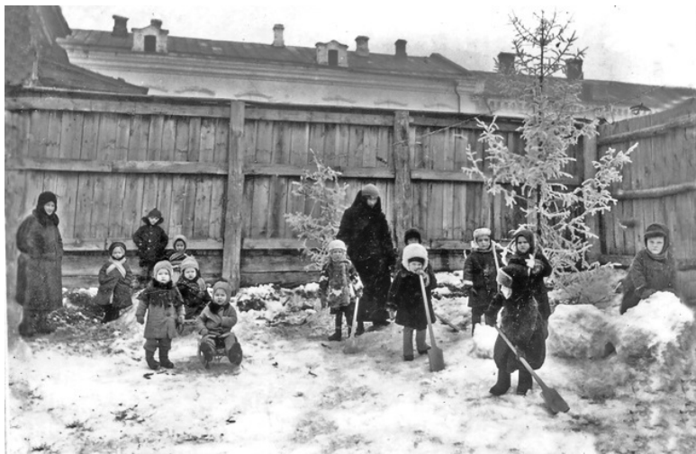
Детский сад на прогулке