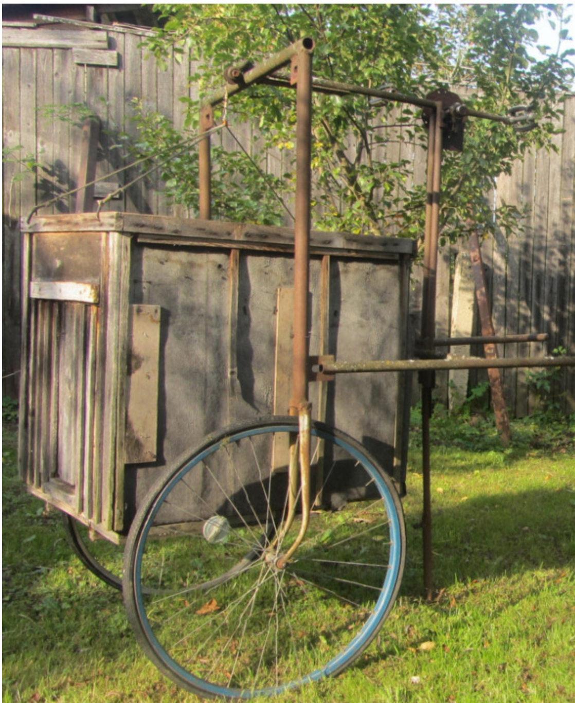
Тележка для перемещения ульев.

Она исполнена на двух велосипедных колёсах с передними вилками, каркаса из водопроводных труб и лебёдки, для которой используется велосипедная pedalная каретка. Прикреплённый с одной стороны к пауку тросик, скользя по ролику, пропускается внутри горизонтальной трубы и закрепляется на оси каретки. Вставляя крючки паука в отверстия верхней обвязки улья и крутя педалями, можно поднять улей и переместить его куда нужно. С помощью тележки я спокойно справляюсь с перестановкой довольно громоздкого улья.