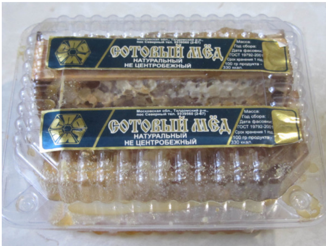
Контейнер для мёда с двумя рамочками.

В контейнере помещаются две рамочки, причём конструктивно рамочки сделаны так, что они плотно сидят в контейнере и не повреждаются при перевозке. Товарный вид изделия очень привлекателен.