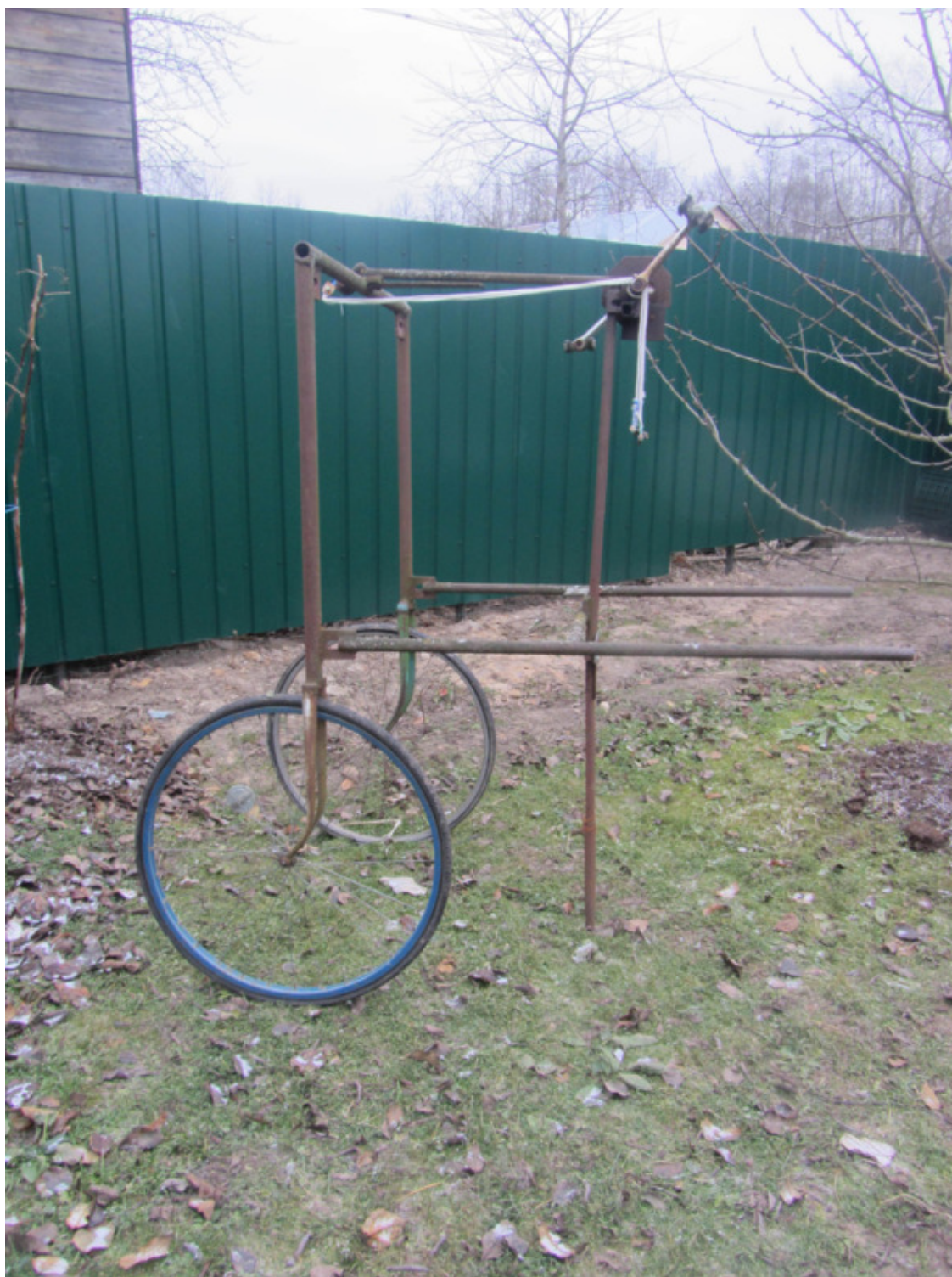
Тележка для перемещения ульев.