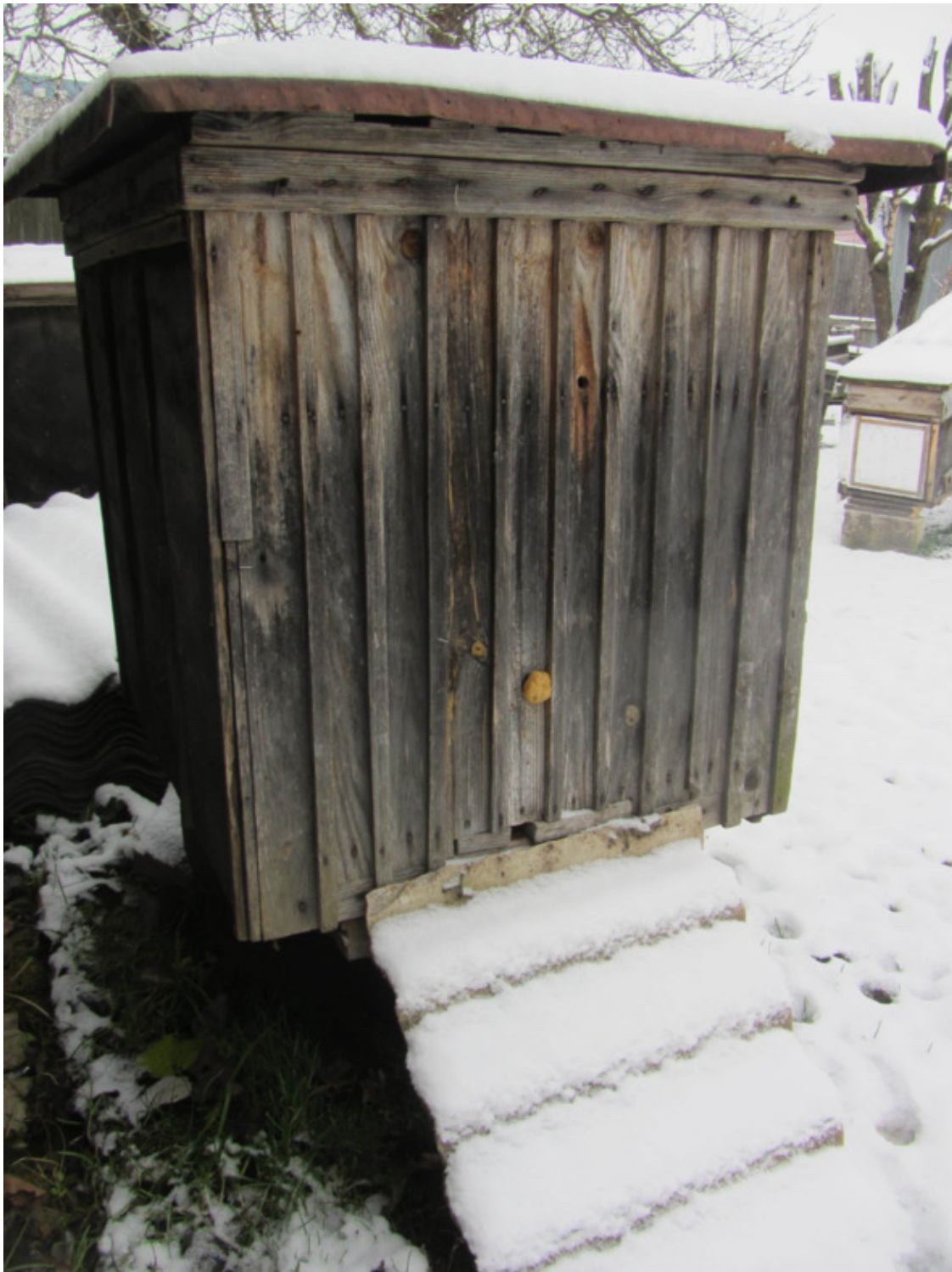
Улей-лежак на 32 украинские рамки.

Этот улей был построен и начал испытываться в 1989 году.