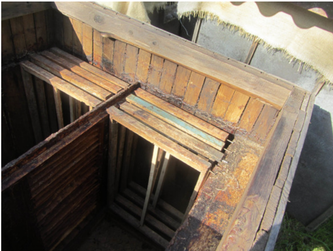
Внутреннее устройство улья-лежака.

зимовка пчёл предполагалась в переднем отделении, переднюю стенку я сделал двойной с утеплителем между стенками (полиэтиленовый мешок с опилками). Улей разделён на два отделения внутренней стенкой, выполненной из доски толщиной 40 мм с вертикальными щелями между досками в 10 мм.