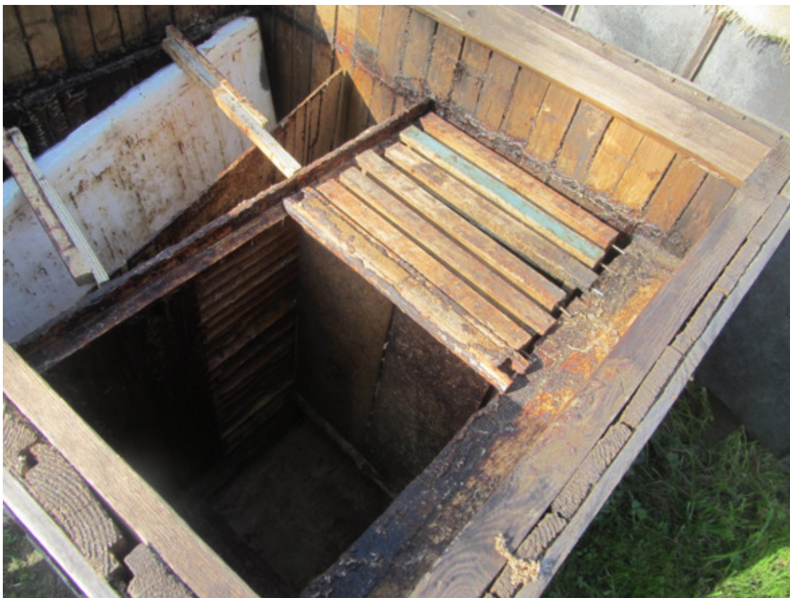
Внутреннее устройство улья-лежака.

Рамки в количестве 16 штук в каждом отделении устанавливаются на холодный занос. Рамки переднего отделения своими плечиками устанавливаются на внутреннюю перегородку и на крайние доски переднего утепления. Рамки заднего отделения устанавливаются также на внутреннюю перегородку и на торцы 10 мм планок, прибитых по всей внутренней стороне задней стенки. По торцу внутренней перегородки вверху устанавливается тоненькая перегородка между плечиками рамок первого и второго отделения, высотой 20 мм, чтобы матка не могла проходить между отделениями поверху. Оба отделения сверху закрываются холстиками и подушками со мхом. На каждый улей предусмотрено две заградительные доски и две моховые подушки по бокам. Крыша лёгкая, съёмная, односкатная, железная без утепления с вентиляционными окнами в обвязке крыши. Леток располагается спереди, нижний щелевой, высотой 15 мм, шириной может быть от всей ширины улья до половины его ширины. Перекрывается леток съёмными вкладышами. Подрамочное пространство – 20 мм, как в типовых ульях. В этом улье не предусмотрены магазины, я предпочитал работать на пасеке с одним типом рамок. Зимовка пчёл устраивается в первом отделении с гнездом не более 10 рамок. Со стороны перегородки утепление делается во втором отделении из целлофанового пакета с опилками. В последнее время я отказался от опилок, заменив их листами пенопласта, обернутыми плёнкой.