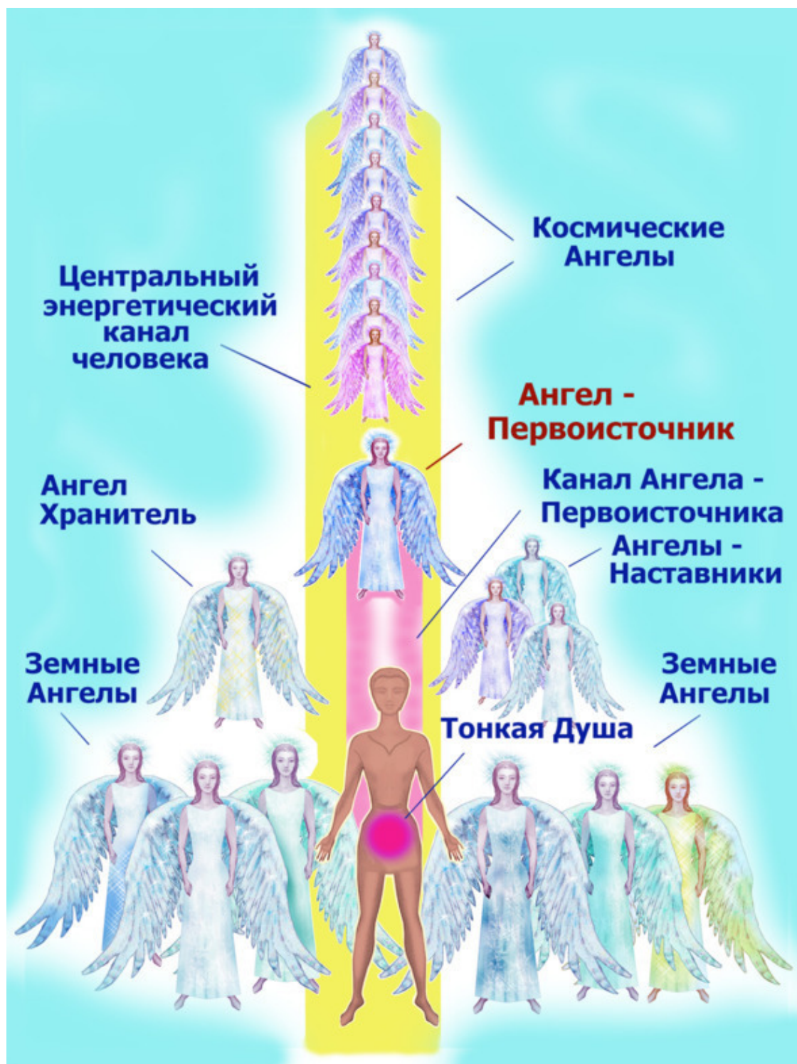
Рис.40. Ангелы человека.

Фактически та индивидуальность человека, которая видна в повседневной жизни, рождается в результате взаимоотношений всех вышеперечисленных энергий, их взаимной договорённости, какие мысли, чувства и действия выдать на поверхность человеческого бытия. Уникальность этого состояния в том, что каждая из названных энергий действительно самостоятельна в своём сознании, которое привносит в решение вопросов жизнедеятельности те аспекты, с которыми связаны эти энергии. Возможно, это несколько сложно в понимании, но именно наличие Тонкой Души в теле даёт ей возможность совершенствования, опыт которого она переносит из воплощения в воплощение, и именно её, как носителя опыта, охра-