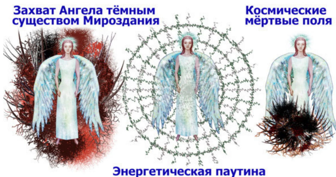
Рис. 42. Космические болезни Ангелов

Человек не совсем земное существо. Здесь имеется в виду его энергетические возможности. Да, его физическое тело действительно живёт на планете Земля, но если говорить о возможностях его сознания, то они значительно выходят за общепринятые рамки простого земного понимания. С другой стороны, болезни человека этого плана могут быть отнесены скорее к проблемам Тонкой Души.