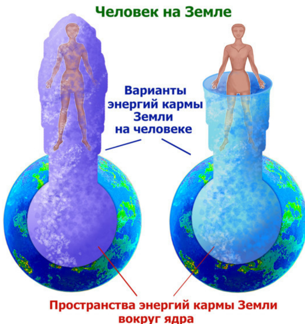
Рис.46. Кармические энергии Земли.

Кармические энергии Земли – это особый класс энергий. Разумеется, история их возникновения человечеству неизвестна, но во время работы с энергоструктурой человека, особенно с тонкими телами и полостями чакр, они проявляются достаточно конкретно. Это определяется запросом к этой энергии. Если они не древнее двух миллиардов лет и не крайне низко-вibrационны, то они отождествляют себя с кармическими энергиями Земли. Как правило, эти энергии опоясывают Землю, но независимо от того, где и на какой высоте находится человек над или под поверхностью Земли, они затрагивают нижнюю часть тонких тел.