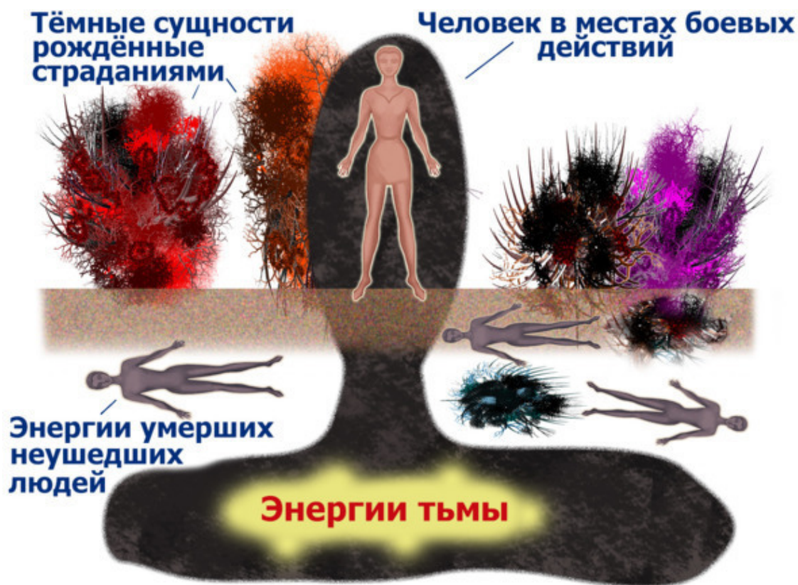
Рис.47. Энергии тьмы.

В результате этого общения эгрегор этой энергии быстро находит в пространстве нового человека и прицепляется к нему. Если эта энергия остаётся на человеке надолго, то со временем у него начинают развиваться различные заболевания нижних частей тела. Другой особенностью этой энергии является её способность отсасывать из энергетики человека чистые энергии его структуры.