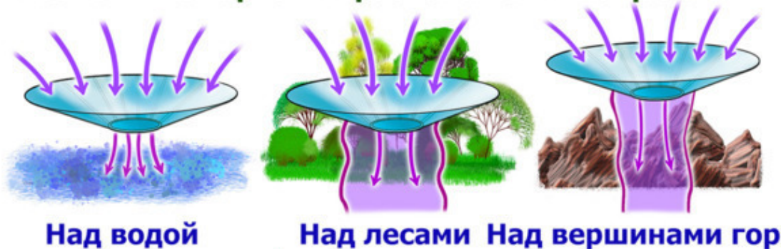
Рис.43. Чакры Земли.

Как видите, всё увязано достаточно логично. Как разумная часть Земли, её недра так же имеют чакровую систему, получающую энергии Творца для жизни и обеспечения её кармического движения в пространстве. Если же говорить о том, что любые катаклизмы Земли являются для неё, как разумного существа, страданием, то можно говорить об отработке её земной кармы с целью повышения вибраций. Возвращаясь к теме чакр тела Земли, можно сказать, что они имеют отношение к множеству энергий, необходимых для её развития. Энергии, которые получает тело Земли, как и для человека, приходят к нему посредством чакр в её теле. По понятным причинам определить их пропорциональное количество по отношению к другим чакрам Земли, весьма затруднительно, да это и не столь важно.