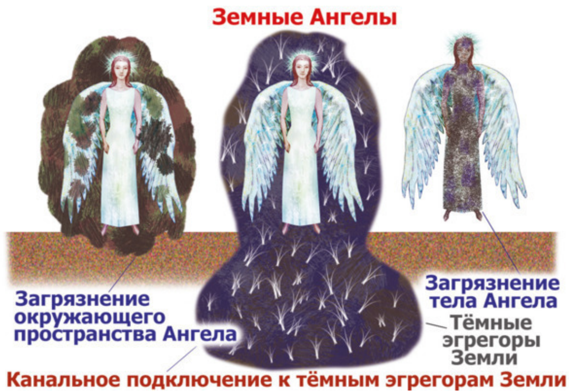
Рис.41. Загрязнение Ангелов тёмными энергиями Земли