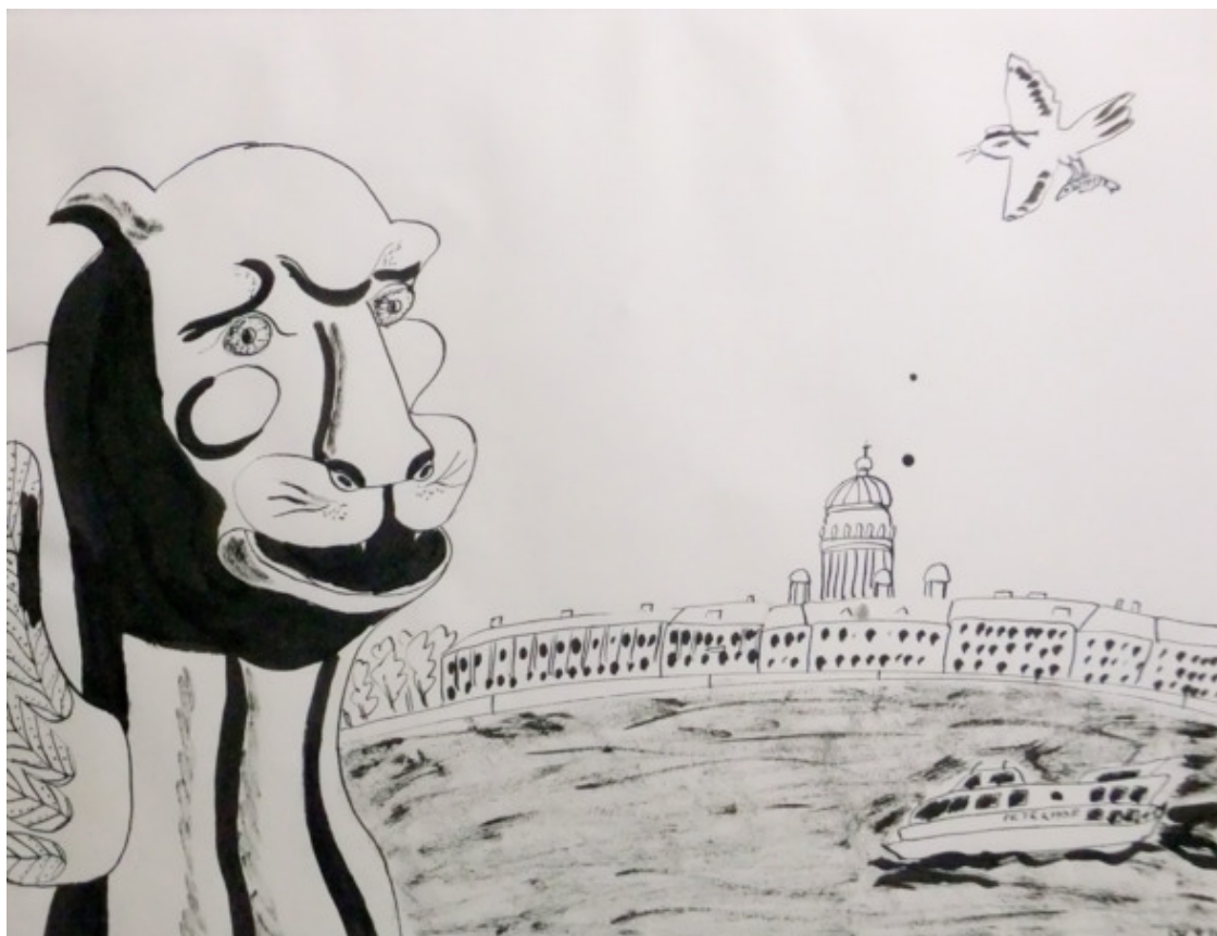
Грифон у Академии художеств. Рисунок Нади Дёмкиной. Тушь, бумага