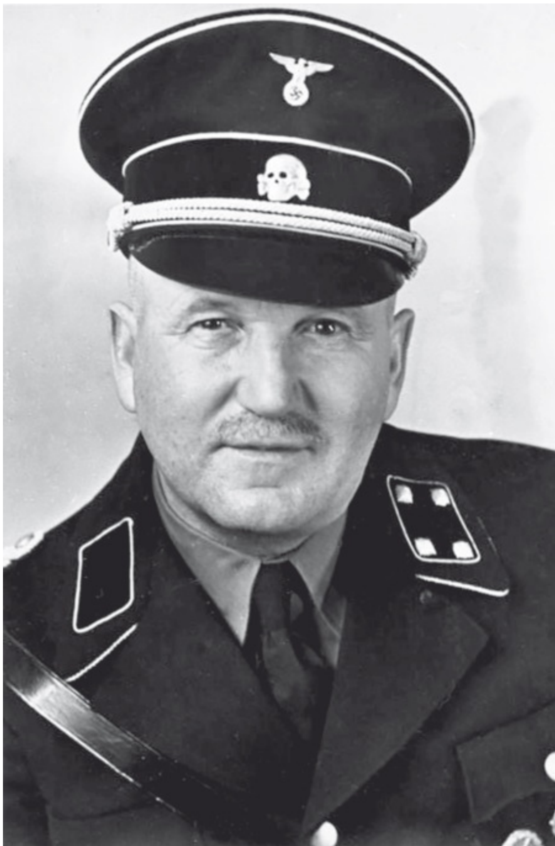
Ульрих Граф (1878–1950) – партийный деятель НСДАП, один из ближайших соратников и первый телохранитель Гитлера, бригадефюрер СС (20 апреля 1943)