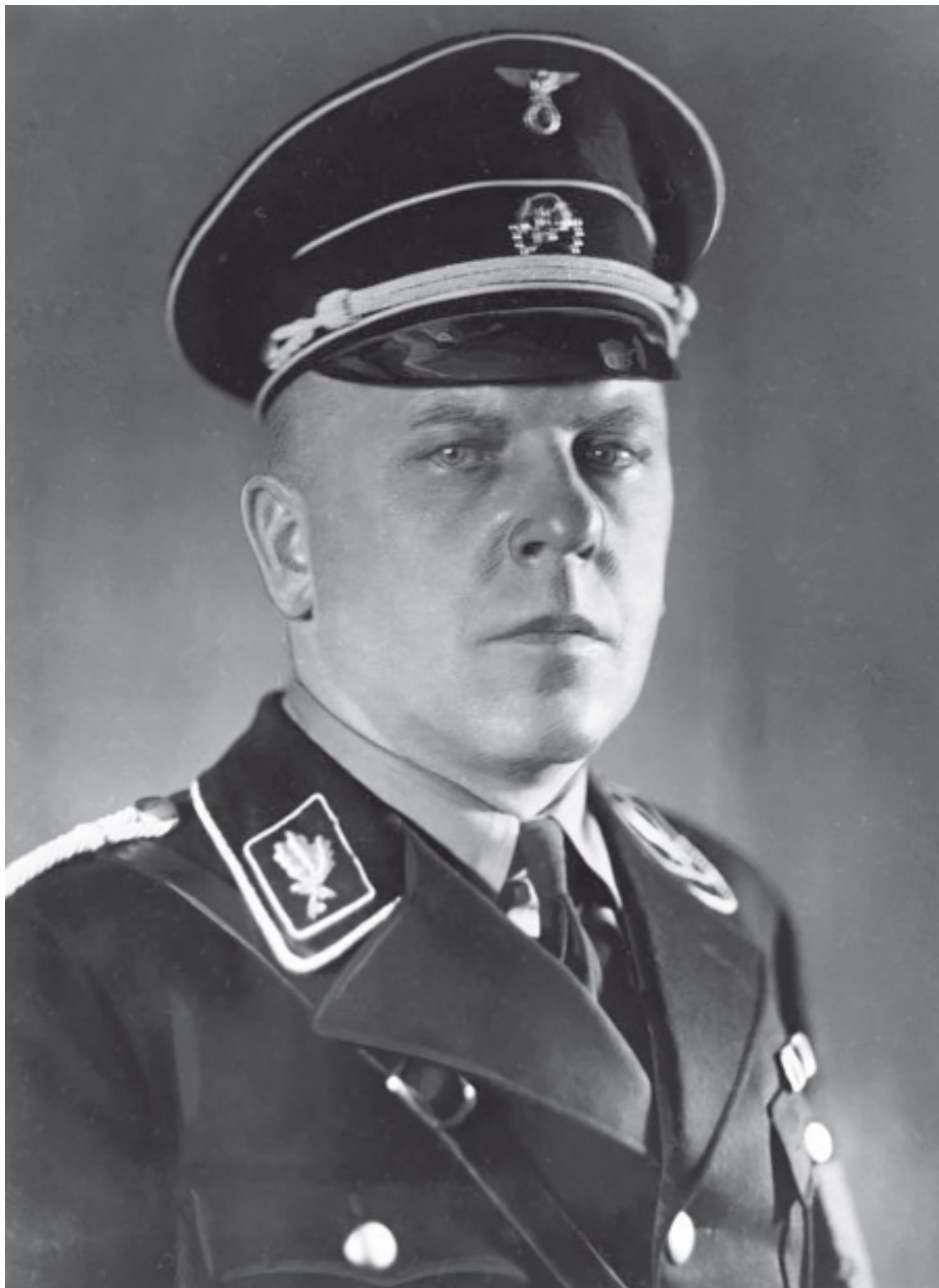
Макс Аманн (1891–1957) – партийный деятель НСДАП, имперский руководитель печати