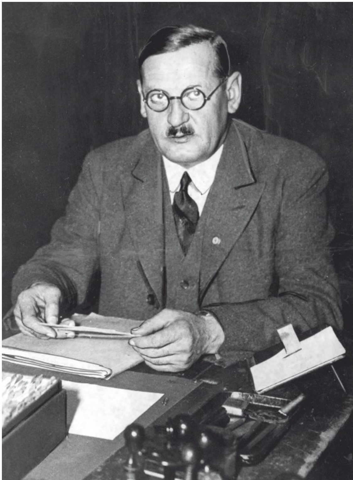
Антон Дрекслер (1884–1942) – основатель Немецкой рабочей партии, которую позднее под новым названием НСДАП возглавил Адольф Гитлер