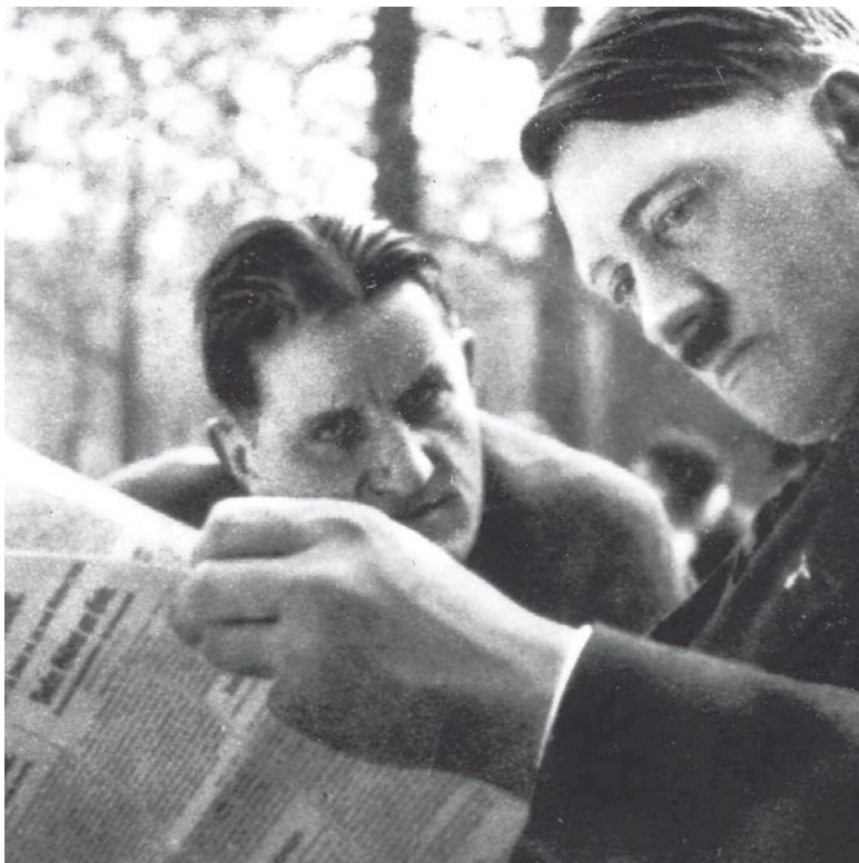
Эрнст Ханфштангль и Адольф Гитлер

Оказавшись на земле, Путци сказал, что пойдет позвонит в Берлин и узнает, каковы будут дальнейшие указания. Вместо этого он позвонил своей секретарше в Берлин и сообщил ей, что его задание было внезапно изменено и он отправляется провести свой пятидесятый день рождения с семьей в