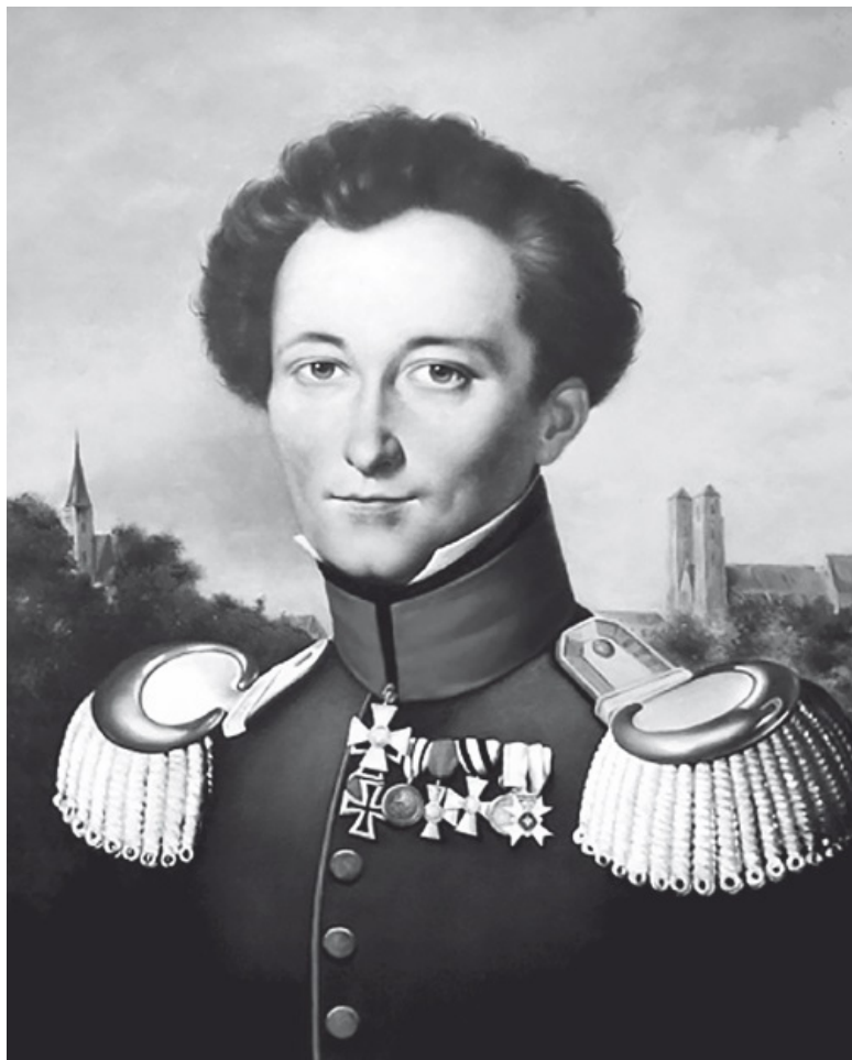
Карл Филипп Готтлиб фон Клаузевиц (1780–1831) – прусский военачальник, военный теоретик и историк. В 1812–