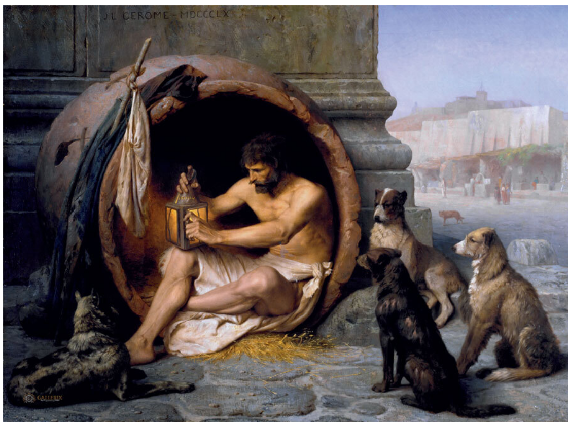
Диоген. Жан-Леон Жером. Музей искусств Уолтерс Балтимор

Памяти моего друга, эрдельтерьера Алькора, посвящаю