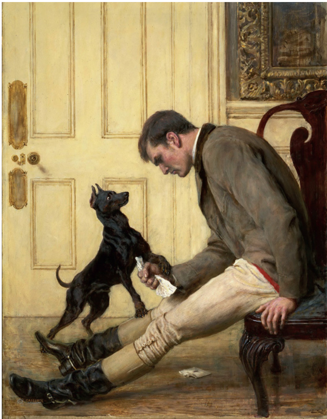
Иван-царевич на Сером волке. Виктор Васнецов. Государственная Третьяковская галерея, Москва.