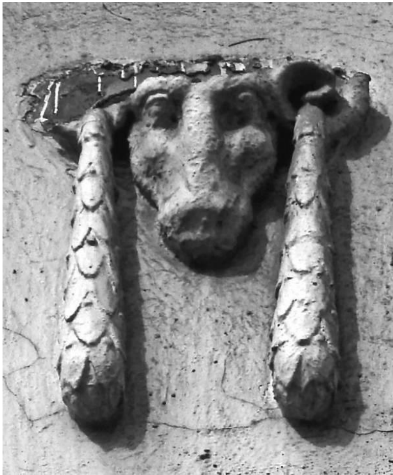
Барашек после модного стилиста. Плотников пер., 3