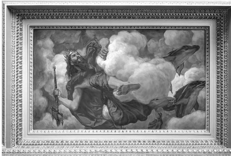
Посейдон в особняке Г.А. Тарасова. Спиридоновка, 30/1