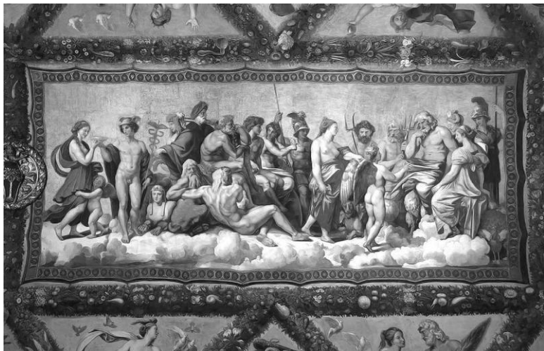
Совет богов. 1517 г. Художник Рафаэль Санти. Рим, вилла Фарнезина