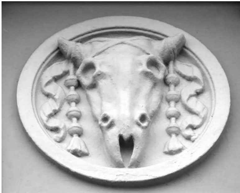
Защитный букраний на здании аудиторного корпуса Московских высших женских курсов. Малая Пироговская, 1