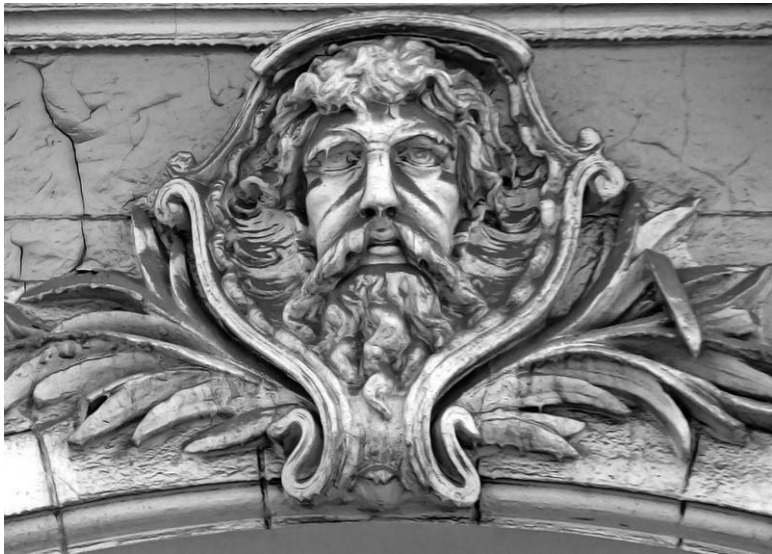
Доходный дом А.С. Смирнова. (1898 г., арх. И.С.Кузнецов). Нащокинский пер., 18/3