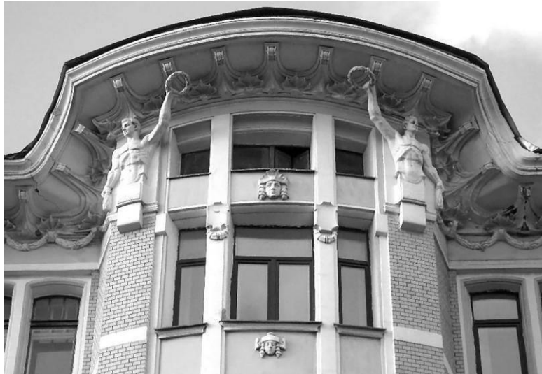
Декор дома княгини Бебутовой. Рождественский бул., 9