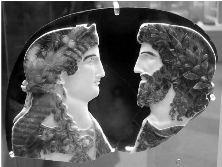
«Зевс и Гера», камея, I в. н. э.

Согласно мифам, в самом центре Олимпа стоял золотой чертог Зевса, в центре которого возвышался высокий золотой трон громовержца, у подножия которого находились богиня мира Эйрена и постоянная спутница владыки богов, крылатая богиня победы Ника (у римлян – Виктория ). Рядом с Зевсом восседала его жена, прекрасная и величественная богиня Гера , у ног которой находилась легкокрылая богиня радуги Ирида . Врата Олимпа охраняли девственные