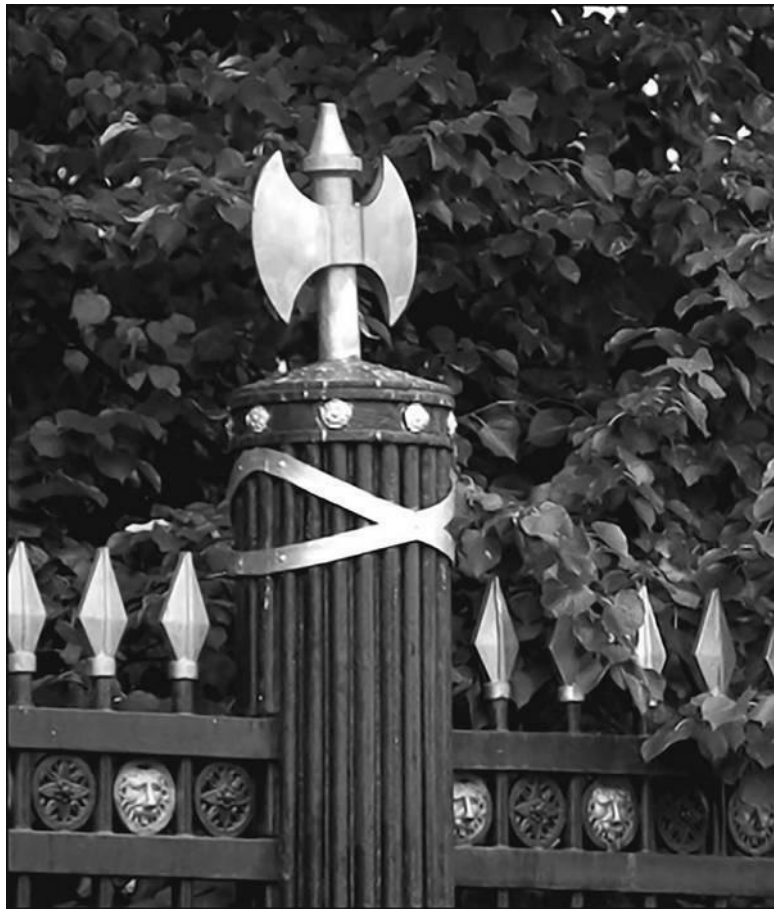
Карающий топор Зевса на решетке Александровского сада