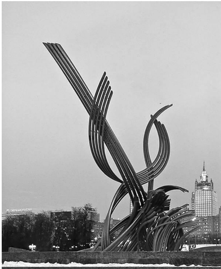
Замысловатый фонтан «Похищение Европы» на площади возле Киевского вокзала