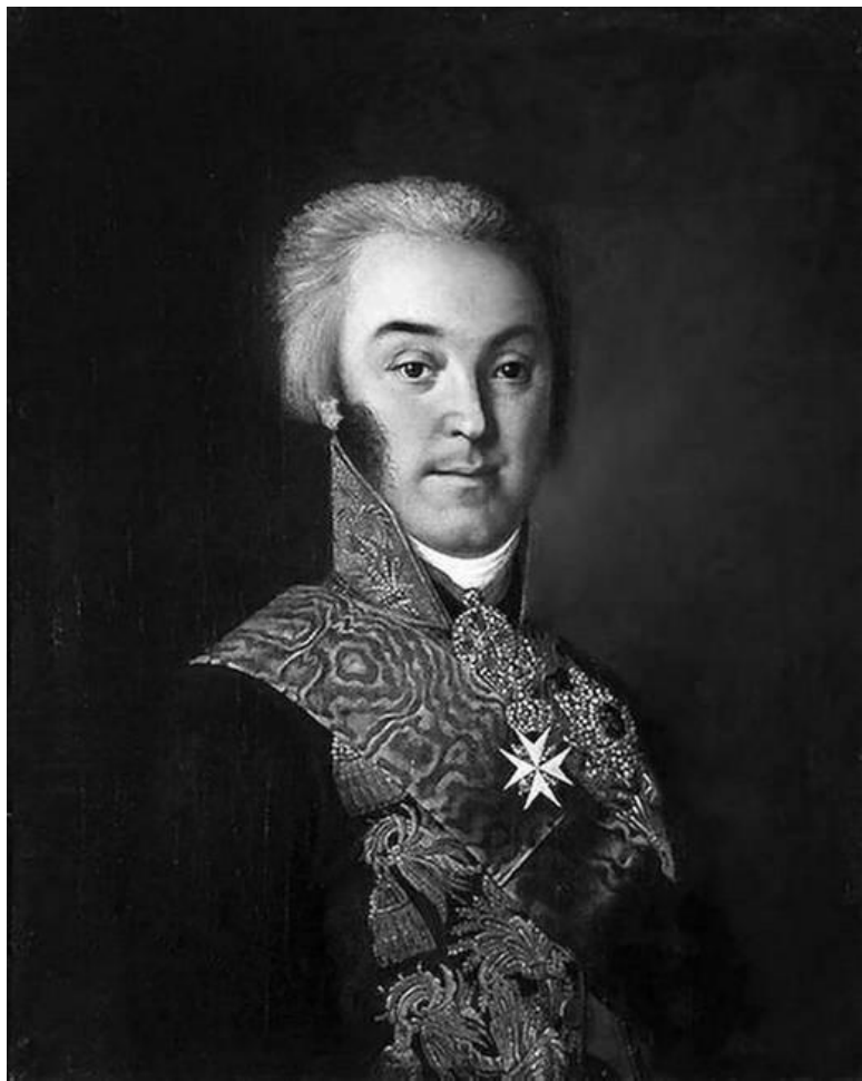
Н.И. Аргунов. Портрет графа Николая Петровича Шере-