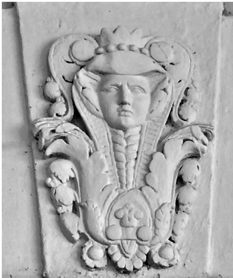
Таинственный иноземец. Усадьба Высокие горы, Земляной Вал, 53