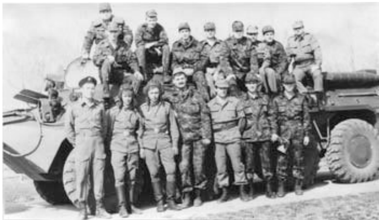
Оперативники отдела на практическом вождении БТР (полигон ОМСДОН)