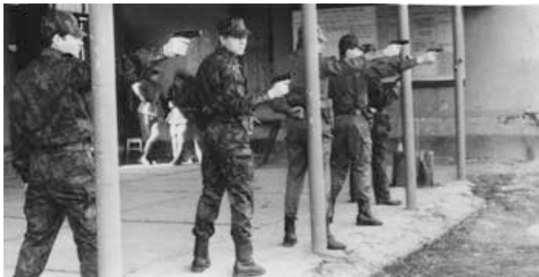
Надёжный «Макарыч» (ПМ) в руках опера только на