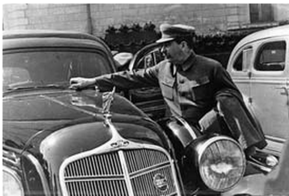
И.В. Сталин осматривает автомобиль «Зис», 29 апреля 1936 г.

Д.Т. Язов: – Я хочу вернуть наш разговор в 30-е годы, когда стране предстояло «пробежать» те десять лет, которые отводил ей Сталин. Она их успешно «пробежала», о чем свидетельствуют многие зарубежные источники. В 1932 году американский журнал «Нейшен» писал: «Четыре года пятилетнего плана принесли с собой поистине замечательные достижения... Россия быстро переходит от века дерева к веку железа, стали, бетона и моторов». Английский журнал «Раунд Тэйбл»: «Достижения пятилетнего плана представляют собой изумительное явление... Советская промышленность, как хорошо орошаемое растение, растёт и крепнет... Пятилетний план заложил основы будущего развития и чрезвычайно усилил мощь СССР». Французская буржуазная газета «Тан»: «Коммунизм гигантскими темпами завершает реконструкцию, в то время как капиталистический строй позволяет двигаться только медленными шагами... В состязании с нами большевики оказались победителями».