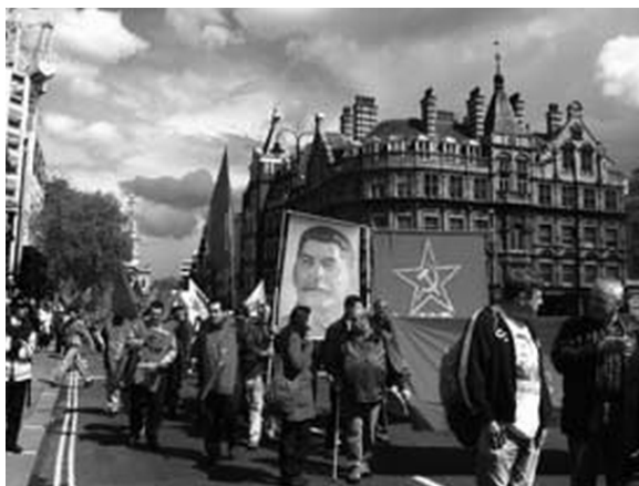
Первомайская демонстрация в Лондоне, 1 мая 2009 года

Сталин создал грандиозное государство, выхватив «русскую цивилизацию» из крошечной бездны, из гражданской войны, из кровавой бесконечности, в которую ухнула русская история после краха Романовых.