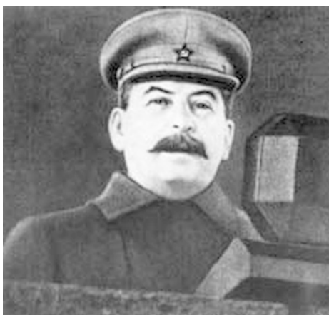
И.В. Сталин на трибуне Мавзолея во время легендарного парада 7 ноября 1941 г.

Д.Т. Язов: – Сталину до финала дойти не позволили. Сошлись на кандидатуре Александра Невского. Слов нет, кандидатура достойная, но кто бы вспомнил о ней, спустя несколько веков, если бы не всё тот же Иосиф Виссарионович. Это он в грозные дни ноября 1941 года, когда немцы стояли у стен Москвы, произнёс с трибуны мавзолея: «Пусть вдохновляет Вас в этой войне мужественный образ наших великих предков – Александра Невского, Дмитрия Донского, Кузьмы Минина, Дмитрия Пожарского, Александра Суворова, Михаила Кутузова». Это был легендарный военный парад 7 ноября 1941 года. Под сталинское напутствие прямо с Красной площади войска уходили на фронт. Кто может вычеркнуть из этой суровой истории имя великого вождя и прославленного полководца?