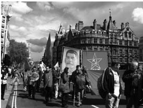
Первомайская демонстрация в Лондоне, 1 мая 2009 года

Вся история русских – это летопись обретения государства и его потери, неоглядные беды и траты, связанные с этой потерей, и новые траты – для восстановления павшего государства. Сталин в русском сознании – великий государственный, потребовавший от народа огромную плату за воссоздание территорий от Курил до Минска и от Крыма до Шпицбергена. За возведение заводов, сумевших перевесить индустриальную мощь Европы. За сотворение культуры и армии, способных, каждая по-своему, сберечь целостность огромной страны.