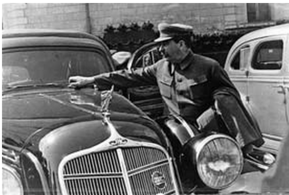
И.В. Сталин осматривает автомобиль «ЗиС», 29 апреля 1936 г.

летнего плана принесли с собой поистине замечательные достижения... Россия быстро переходит от века дерева к веку железа, стали, бетона и моторов». Английский журнал «Ранд Тэйбл»: «Достижения пятилетнего плана представляют собой изумительное явление... Советская промышленность, как хорошо орошаемое растение, растёт и крепнет... Пятилетний план заложил основы будущего развития и чрезвычайно усилил мощь СССР». Французская буржуазная газета «Тан»: «Коммунизм гигантскими темпами завершает реконструкцию, в то время как капиталистический строй позволяет двигаться только медленными шагами... В состязании с нами большевики оказались победителями».