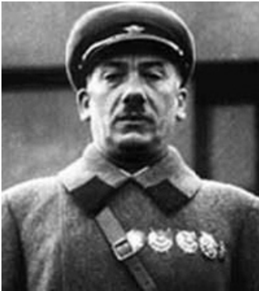
Генрих Григорьевич Ягода

Надо сказать, что Русский Север И. В. Сталин знал сравнительно неплохо. В свое время он отбывал ссылку в Сольвычегодске Архангельской губернии, а, накануне революции 1917 года, был в ссылке еще севернее – в Туруханском крае. В начале Гражданской войны Сталину приходилось непосредственно заниматься вопросами обороны Мурманска. Занимался вопросами Севера Сталин и став Генеральным секретарем ЦК ВКП(б). В одобренной Сталиным в 1931 году «Программе строительства военно-морского флота», была