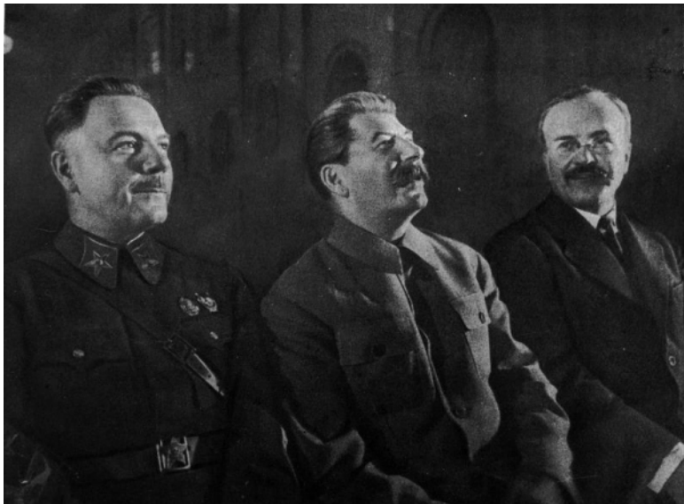
Климент Ворошилов, Иосиф Сталин, Вячеслав Молотов