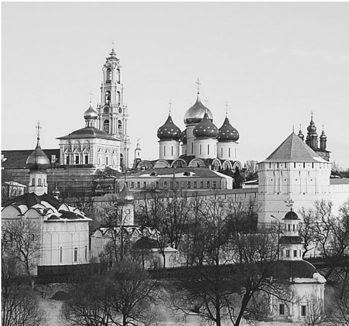
Троице-Сергиева лавра. Здесь хранилась рукопись с упоминанием об Иоганне из Иерусалима

Об этом человеке мало что известно. Говорят, он родился в 1042 году и умер в 1119 году. В промежутке между этими двумя датами он участвовал в создании таинственного ордена тамплиеров и составил книгу пророчеств, в которой есть упоминания о значительных событиях третьего тысячелетия. Где эта книга? Что в ней написано? Откуда он все знал?