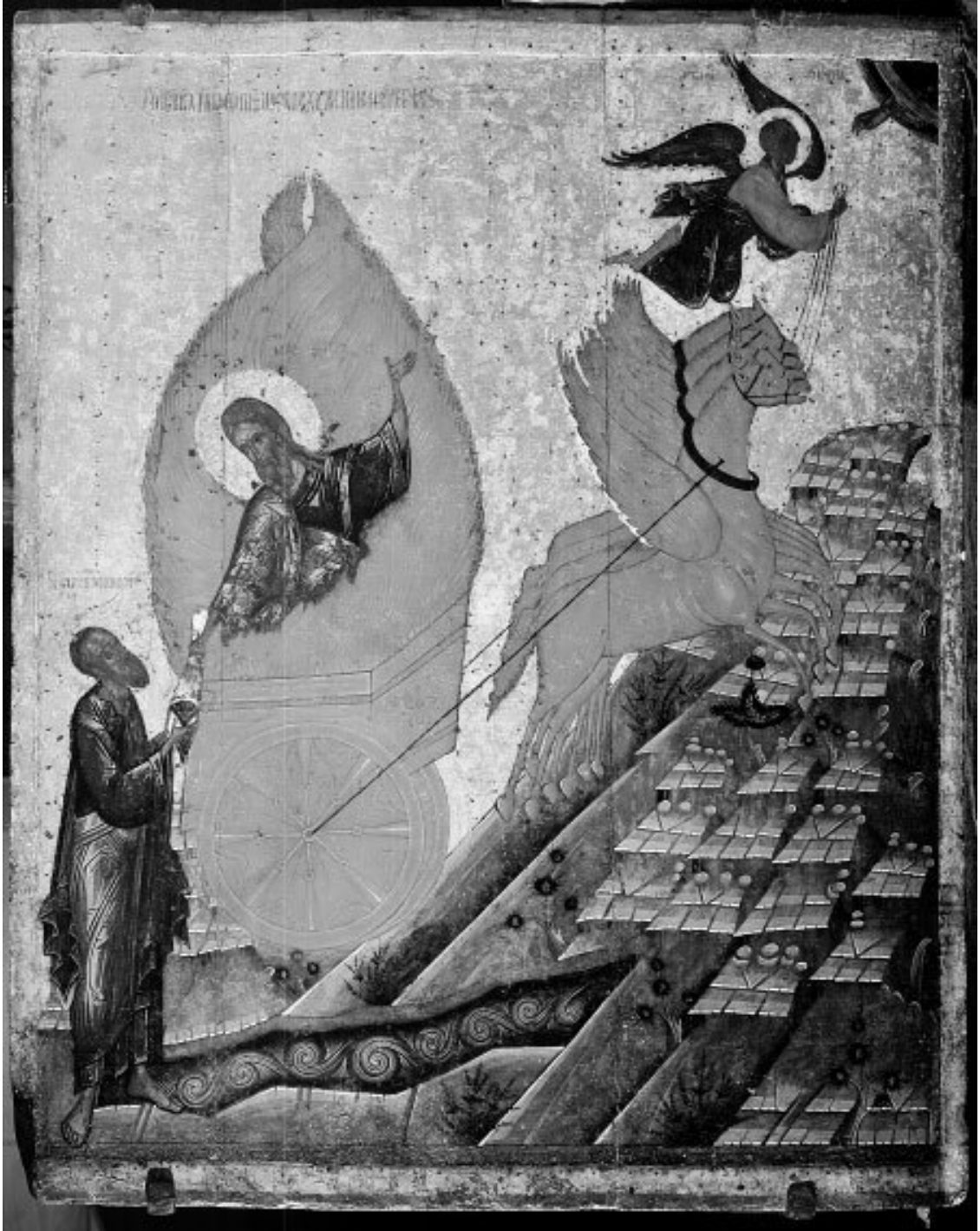
Вознесение Или Пророка