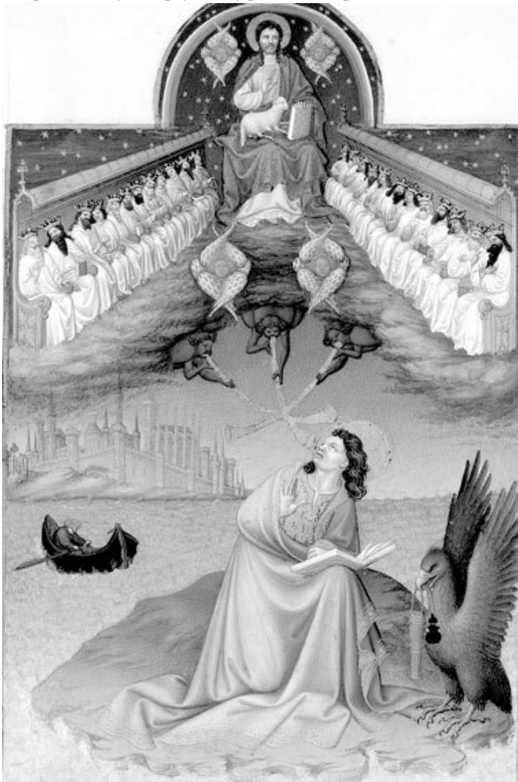
Откровения Иоанна Богослова

Откровение св. Иоанна Богослова – самая таинственная, интересная и в то же время пугающая книга Библии. Единственная пророческая книга в Новом Завете посвящена финальному аккорду, концу развития мира.