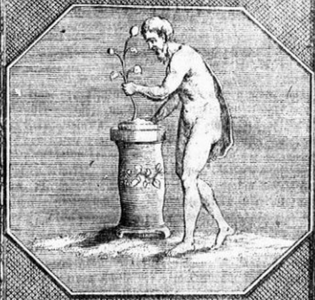
EPIMENIDES Ex Pictyloth. Lipperti