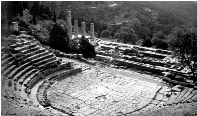
Святилище Аполлона в Дельфах

Так, самым знаменитым в древней истории считался оракул, находившийся в святилище Аполлона, на склоне известной горы Парнас, в древнегреческом городе – Дельфы.