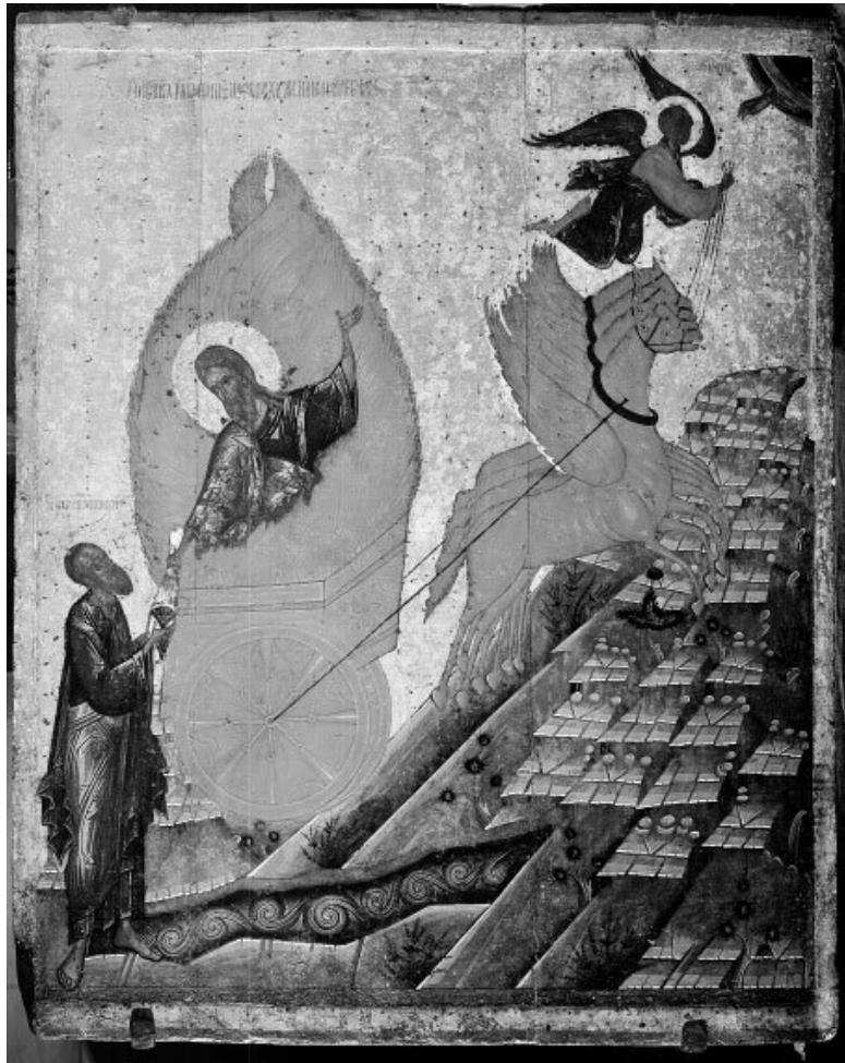
Вознесение Илии Пророка