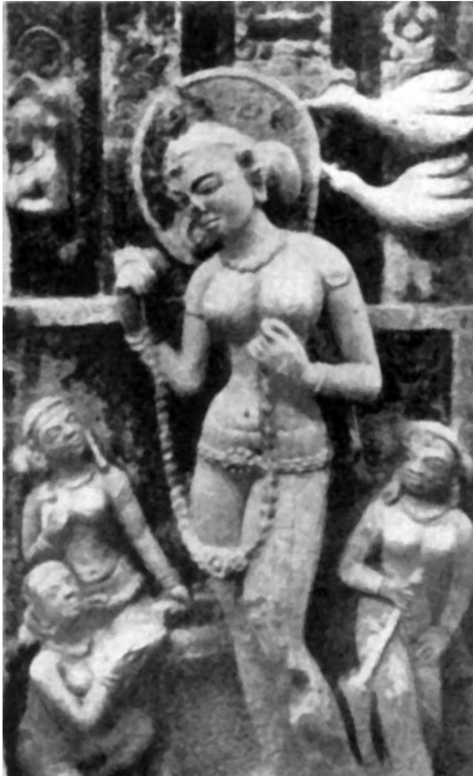
Ямуна – персонификация реки Джамны

Реки – средоточие жизни. Издревле возле них возводились города и поселки, к их берегам была привязана хозяйственная деятельность человека, по водам плавали лодки и корабли. Они перевозили людей и товары