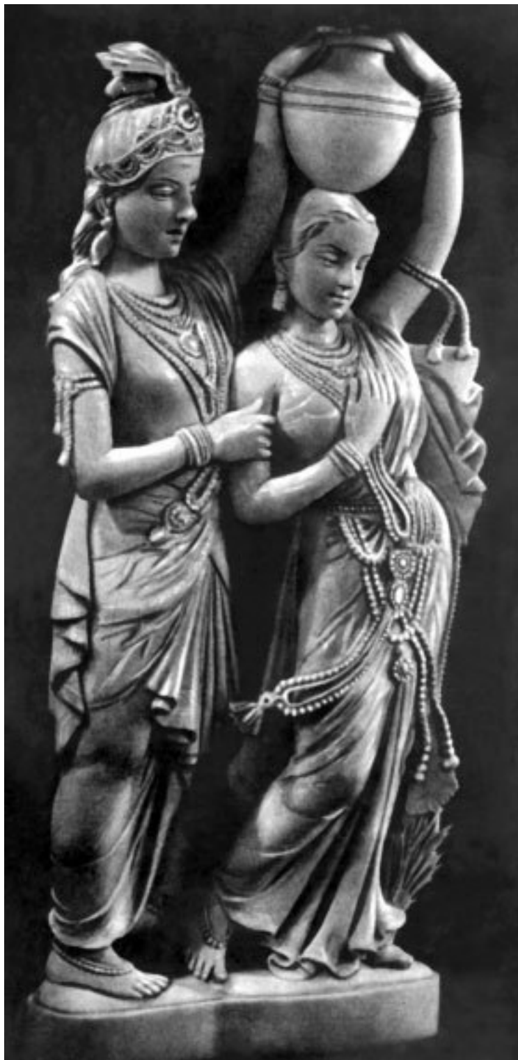
Кришна и Радха. Статуэтка из слоновой кости

Неповторимые изделия из слоновой кости обнаружены при раскопках на огромном ареале северо-западной части индийского субконтинента, то есть их родина – вся древнейшая цивилизация долины Инда!