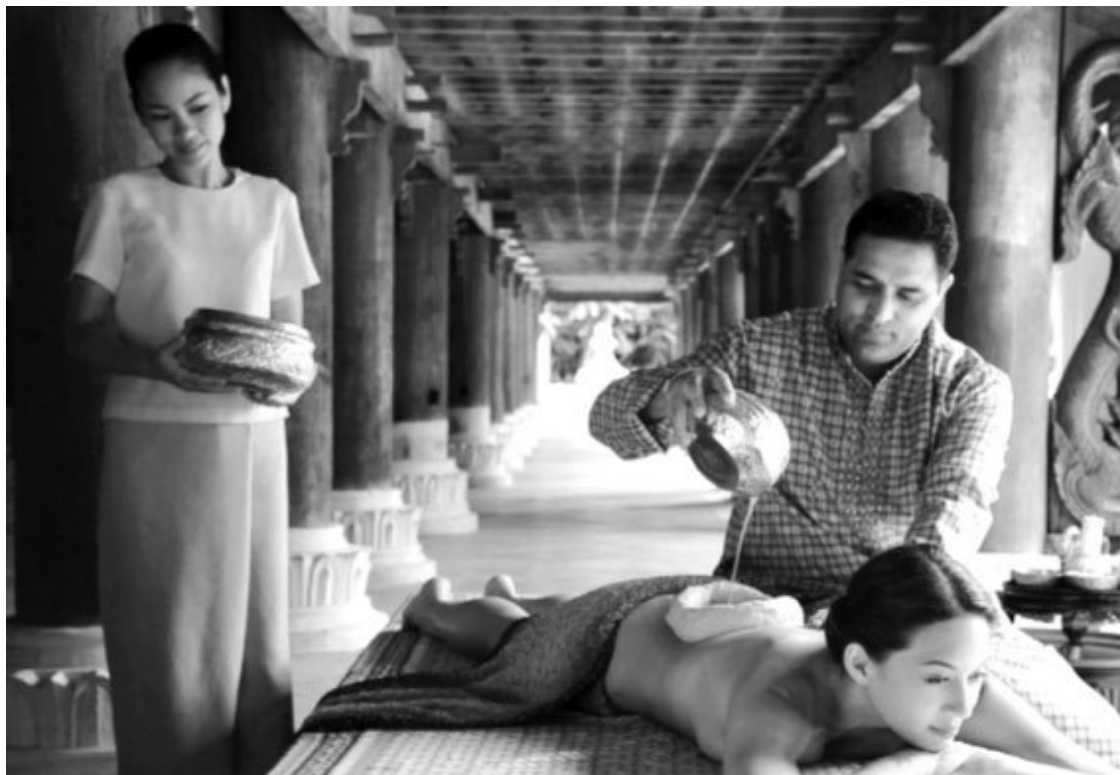
В одном из многочисленных современных аюрведических центров

Обычно санскритское слово «аюрведа» переводят термином «медицина», хотя последнему гораздо более соответствовал бы термин «биология», ибо аюрведа буквально означает «знание о долголетию, долгой жизни»