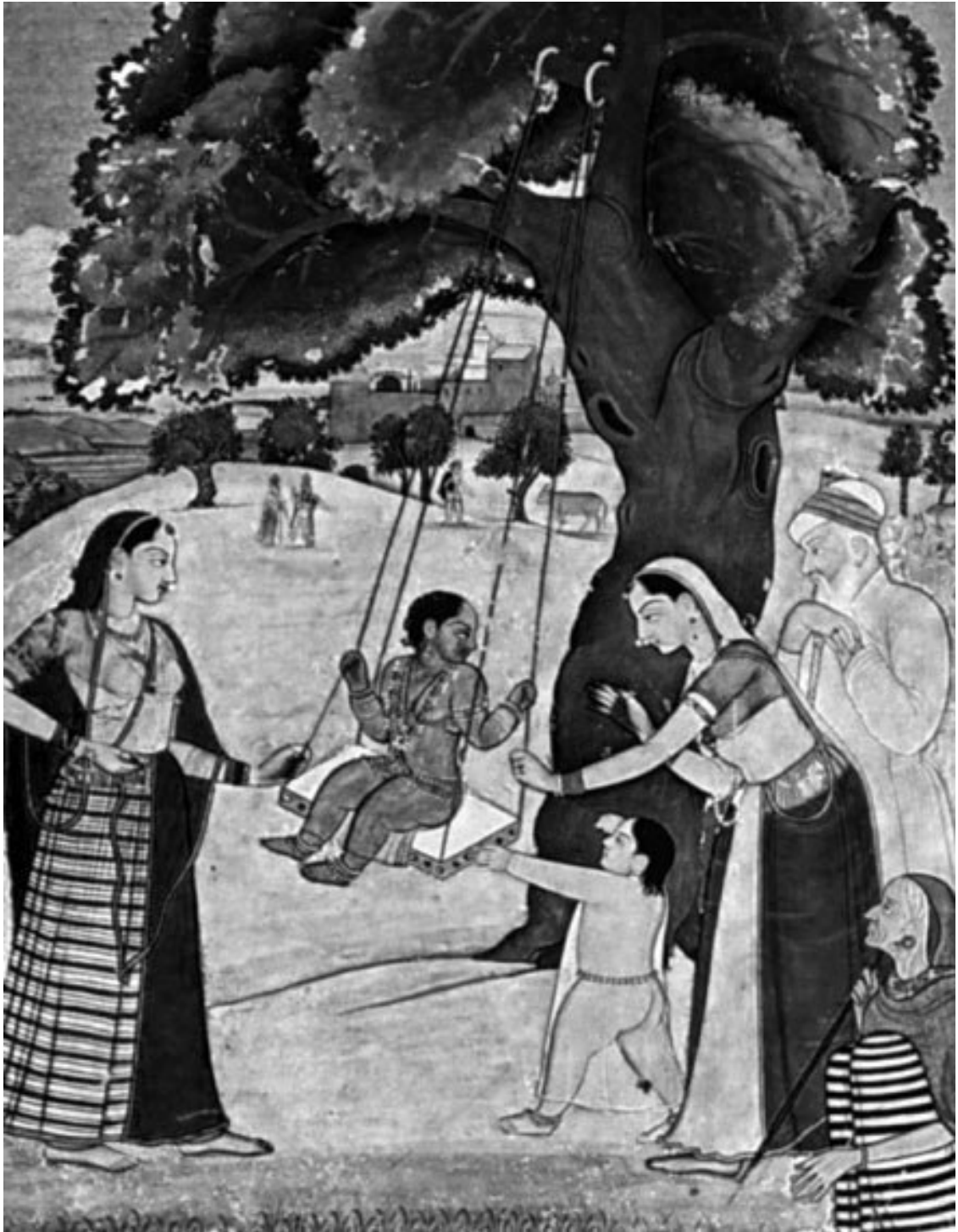
Индийская семья на средневековой миниатюре

Главная цель каждого новорожденного в индусской семье – грядущее бракосочетание. Детям внушают с самого раннего возраста, что они растут для того, чтобы при достижении предназначенного традицией возраста заключить брак со своей парой и дать жизнь потомству