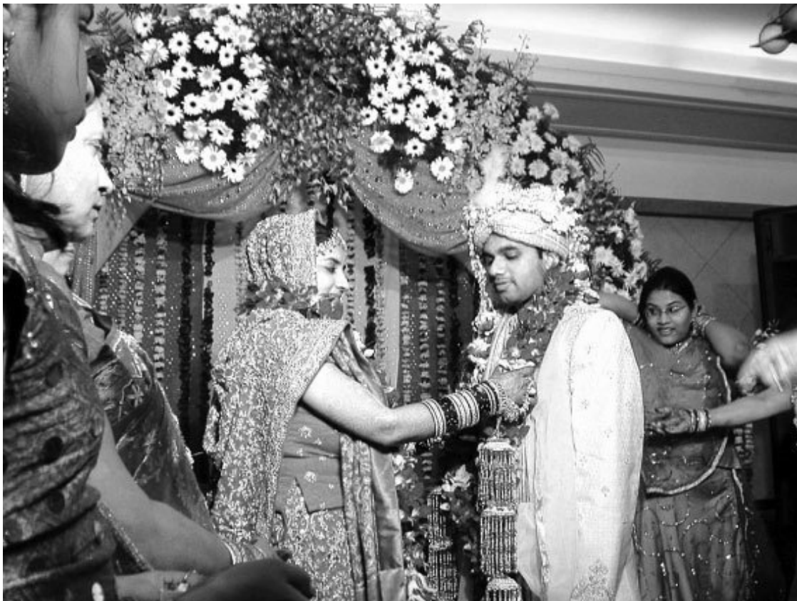
Свадьба – одно из важнейших событий в жизни индийской девушки

Хотя брахманы, авторы особого рода сочинений «смрити», составлявшие правила благочестивого поведения для мирян, во многих отношениях отличались известным пуританизмом, они отнюдь не отвергали физической любви. Из трех целей жизни последняя, т. е. получение наслаждений, хотя и уступала по своему значению двум другим, признавалась вполне законной сферой деятельности людей