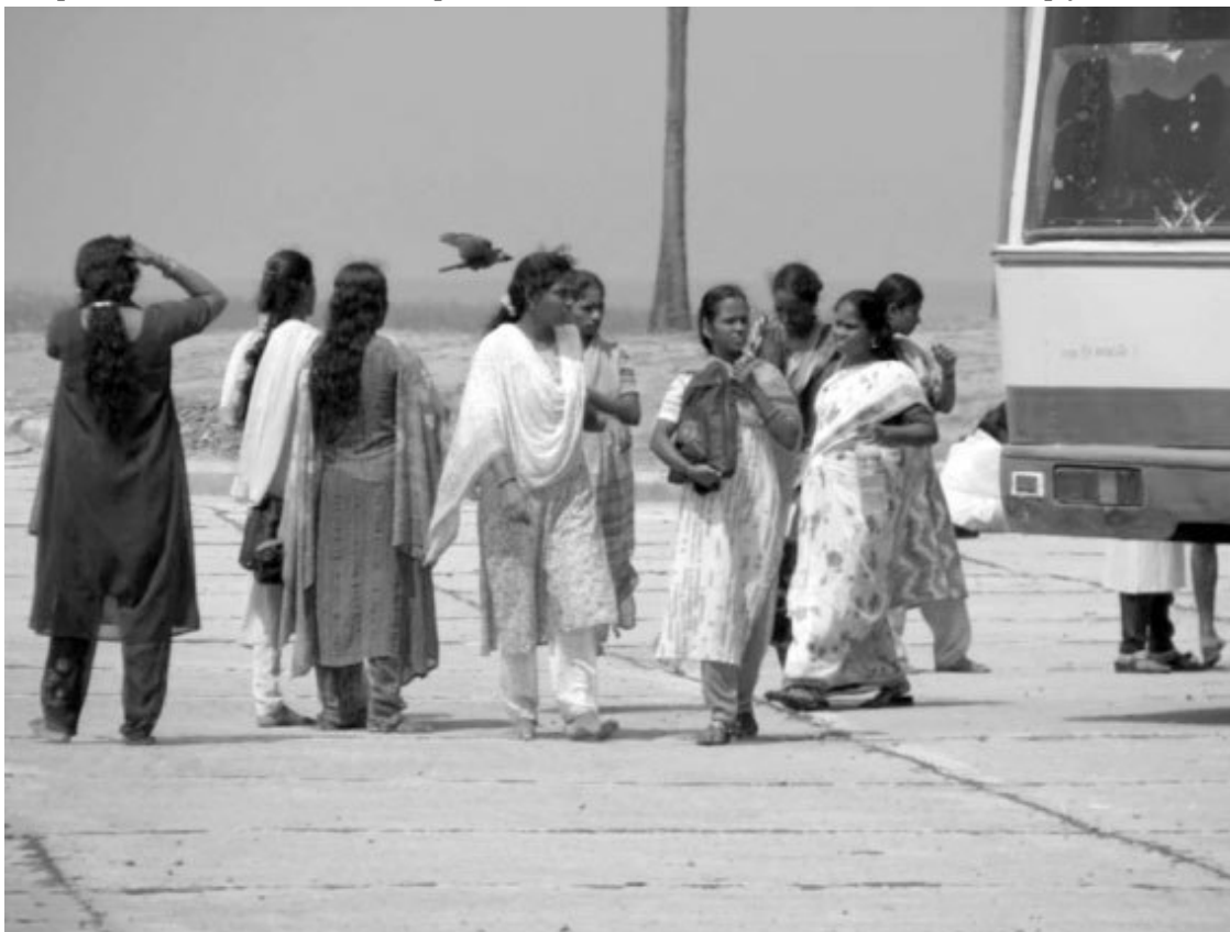
Индийские женщины с древних времен и до наших дней с удовольствием носят сари

Жители Индии, по-видимому, не знали шитой одежды почти до рубежа нашей эры. Они драпировали свое тело полностью или – что гораздо чаще – частично самыми разнообразными способами и в самые разнообразные ткани, но что это было, сказать невозможно: то ли набедренные повязки, то ли широкие пояса, то ли какие-то юбочки и шарфики