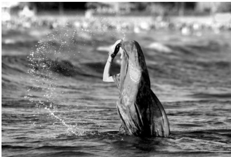
Женщина оmyвает себя водой во время молитвы заходящему солнцу

Какое отношение к воде диктуют индийские мифы ныне живущим людям? Какую роль вода играет в ритуальной и бытовой жизни индусов? Наконец, какие основные идеи связаны с фактом зарождения жизни в воде, давно отраженным в древних индусских мифах и лишь недавно установленным мировой наукой? Стремилась ли отдаленные предки человека доказать своими мифами, что человек может даже опустошать и заполнять ложе океана?