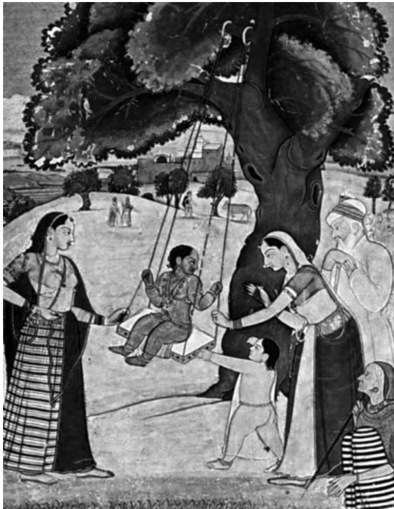
Индийская семья на средневековой миниатюре