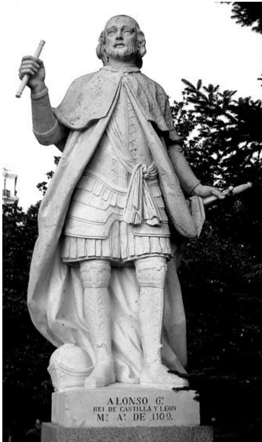
Король Кастилии Альфонс VI. Скульптур Ф. Дель Корраль. XVIII в.

Беглец, ставший королем Кастилии, Леона и Галисии, отвоевавший у мавров (арабов) большую часть Пиренеев