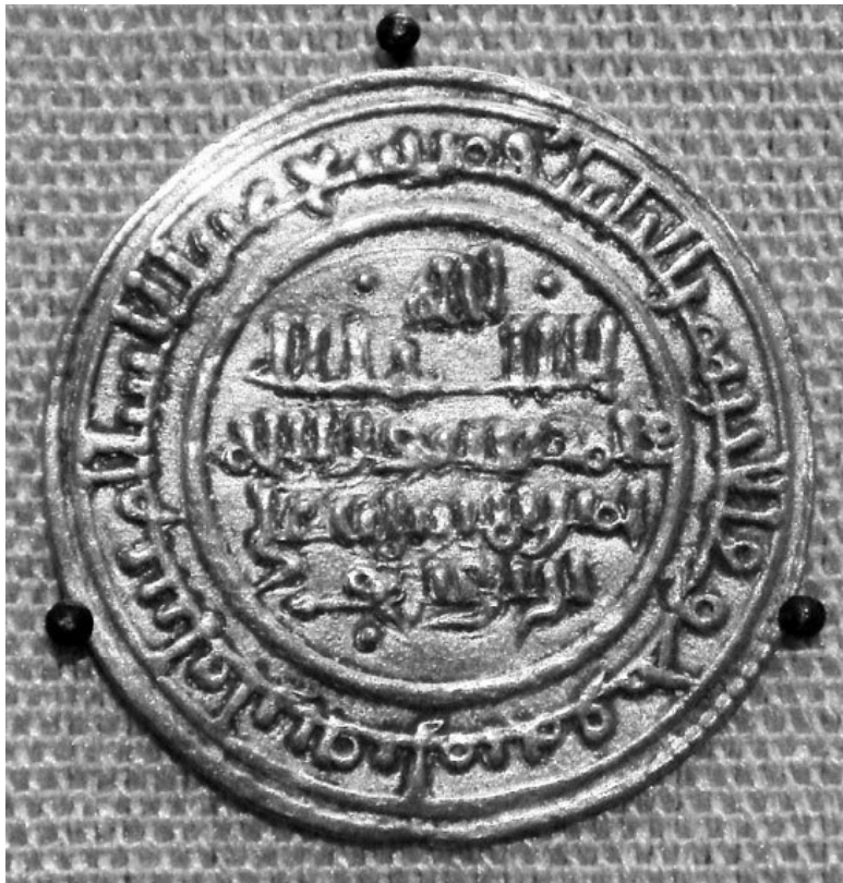
Монета периода правления Абу-Бекра

Черная Африка в эпоху раннего Средневековья остается для мировой истории огромным «белым пятном». Исторический занавес над землями южнее пустыни Сахары в те века обычно приподнимается во многом благодаря соседству