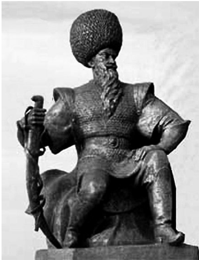
Сельджукский султан Алп-Арслан. Современная скульптура