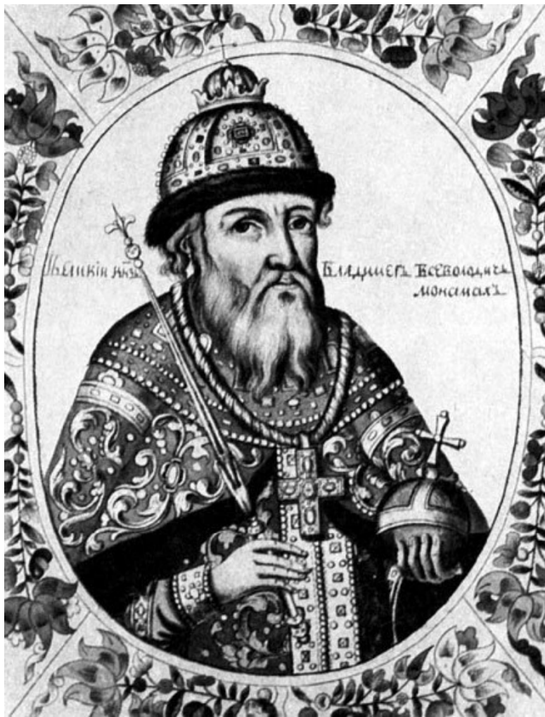
Владимир Мономах. Иллюстрация из «Титулярника»