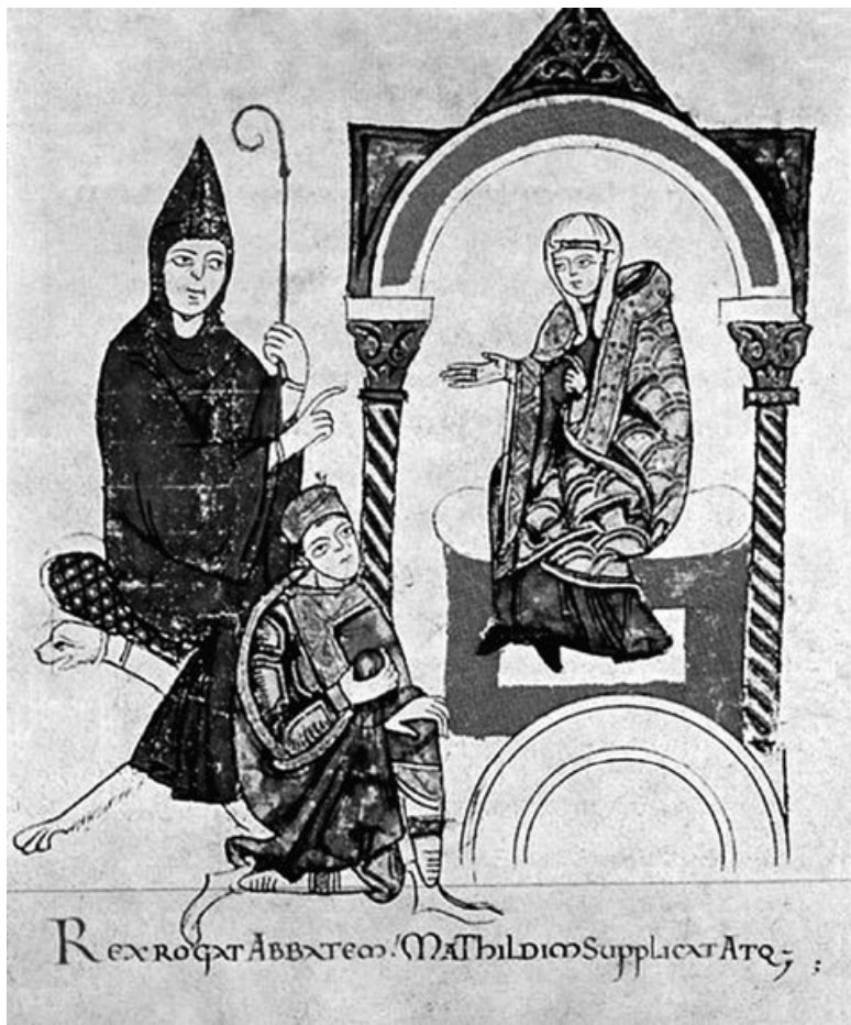
Генрих IV обращается к Матильде Тосканской и Гуго Клунийскому за помощью. Старинная миниатюра