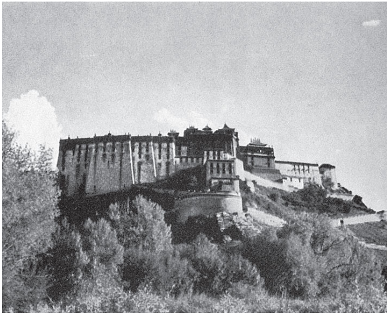
Вид Поталы с севера