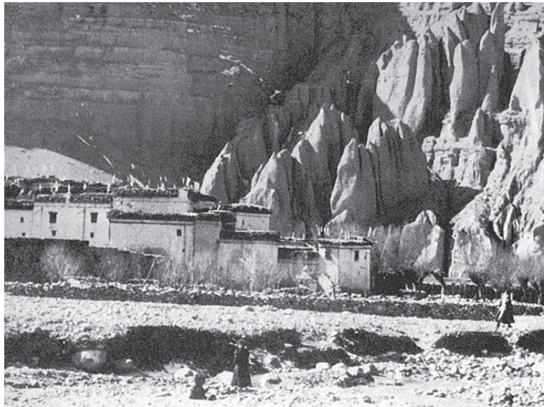
Тибетская деревня в Гималаях