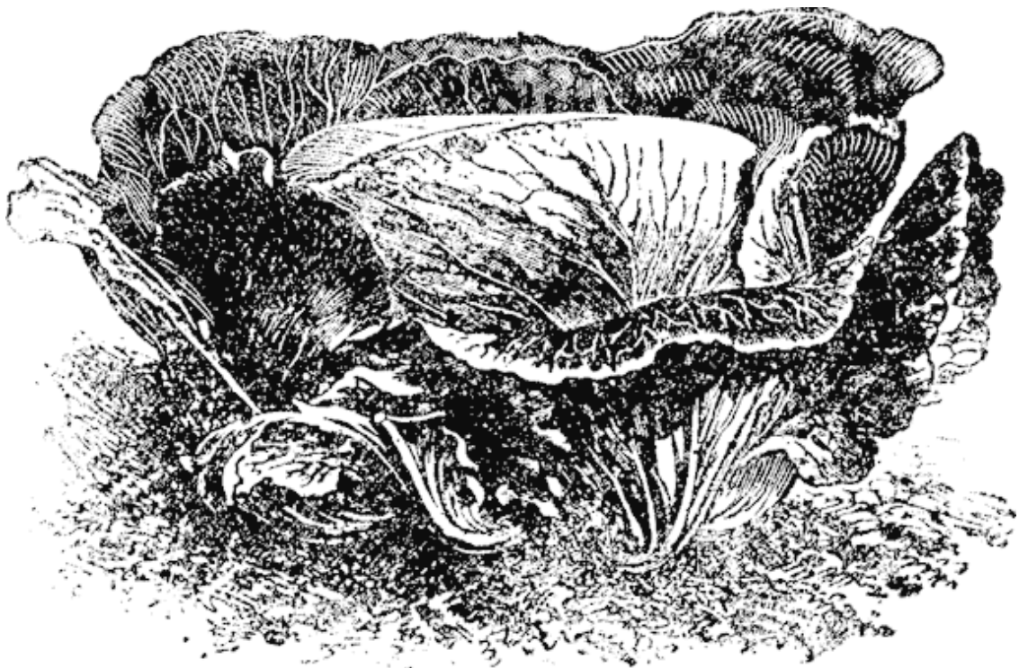
Рис. 3. Капуста «Брауншвейгская»

Но пудовую капусту можно вырастить только из поздних и средних сортов. Из таких сортов можно рекомендовать: «Слава» – отличный для севера сорт, неприхотливый на почву.