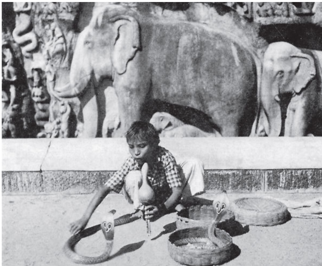
Илл. 4. Мальчик-заклинатель змей с коброй на улице Махабалипурама. Сзади изображение рельефа со слонами

Может показаться странным, но среди этой безжалостной и дикой природы у людей возникла огромная любовь ко всему живому, принимающая порой гипертрофированные формы, а также утвердилось неукоснительное признание права всякого существа на жизнь. Эту черту народной психологии подметил К. Бальмонт, побывавший в Индии: «И если мать увидит на своем ребенке скорпиона, она лишь сбрасывает его на землю, не прерывая нить его жизни и не впутывая своего действия в сложный узор его мировых блужданий». Даже ядовитая кобра, случайно заползшая в дом, может не опасаться за свою жизнь: ее вежливо попросят выйти или вынесут за дверь. В сутолоке и суете любого города вполне уютно чувствуют себя дикие белки, ящерицы, павлины, мелкие пернатые и другие представители животного царства. И совсем как полноправные хозяева ведут себя обезьяны; для индийцев они – потомки Ханумана, легендарного предводителя обезьян, героя эпоса «Рамаяна».