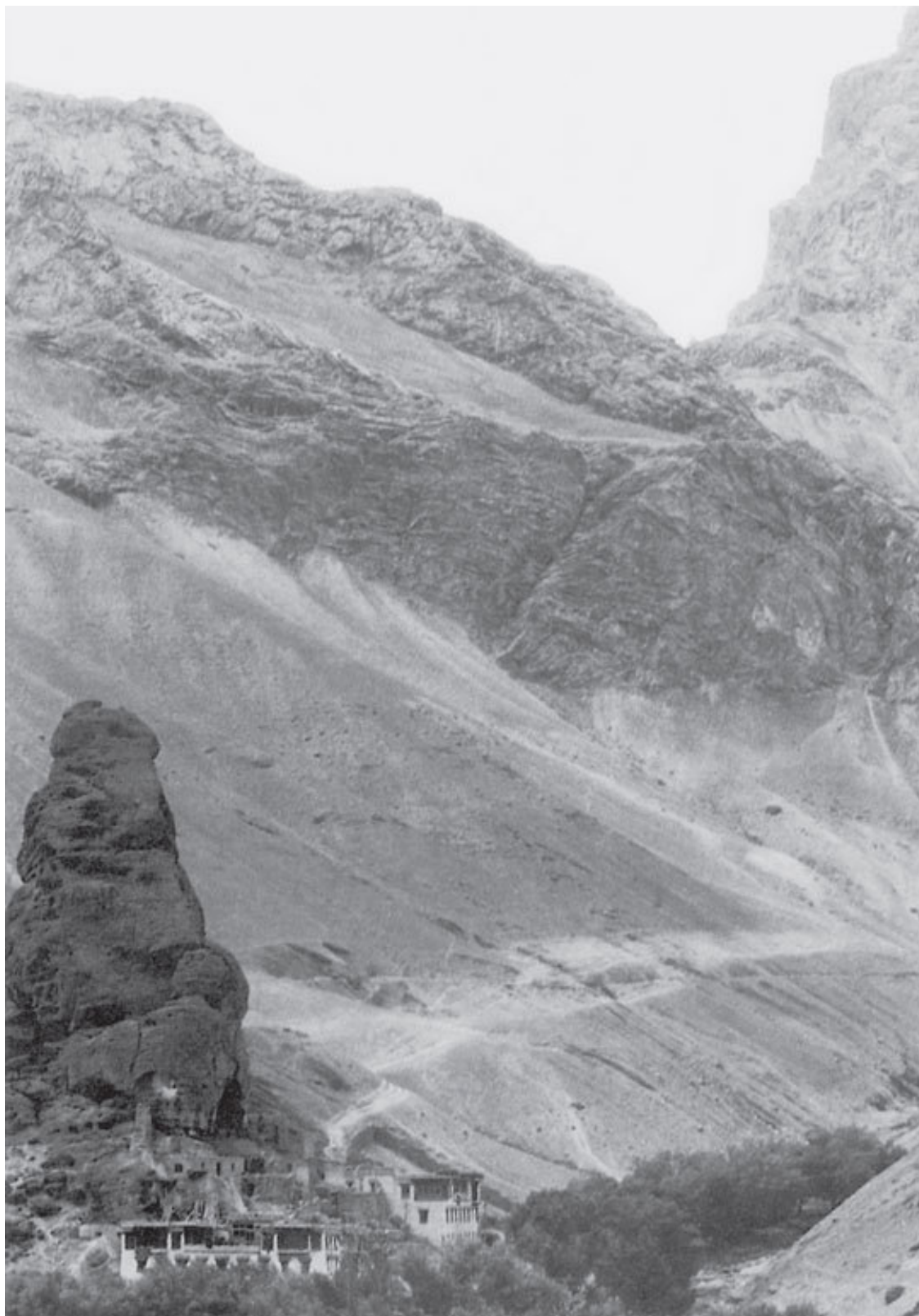
Илл. 2. Ладакх – местность на крайнем севере Индии (штат Кашмир) – знаменит своим суровым климатом. Это один из центров индийского буддизма

Достаточно взглянуть на карту, чтобы увидеть, как особо выделен индийский субконтинент самой природой: с севера он огорожен Гималаями, а с востока, запада и юга окружен водами – Бенгальским заливом, Аравийским морем и Индийским океаном. Природа словно распорядилась: жить Индии жизнью «великолепного одиночества». Эта изоляция была одной