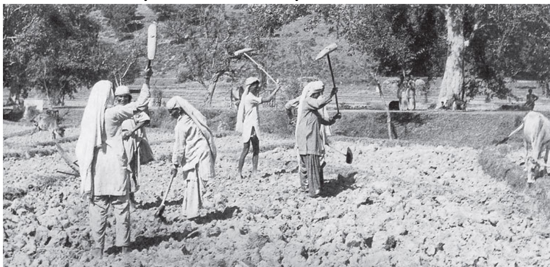
Илл. 9. Крестьяне, обрабатывающие поля

Нам, живущим в современном урбанистическом мире, который неумолимо отторгает нас от природы с ее извечными ритмами и устоями, пожалуй, трудно понять до конца глубину этих утверждений. Мы привыкли к тому, что нас окружает антропогенный пейзаж, и забыли, что значит жить в согласии с природой. Суть в том, что мы действительно почти никогда не ходим по земле босиком и потому, да и не только потому, совсем забыли о ней.