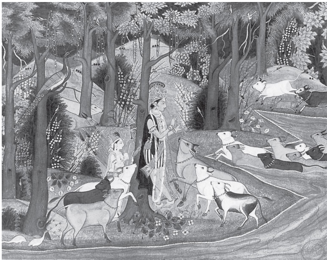
Илл. 6. Кришна-пастух. Миниатюра Раджастанской школы

Вот как передала свое переживание индийской природы Е.П. Блаватская: «Среди этой дивной природы, где так и тянет стряхнуть с себя земные оковы, обобщиться с нею жизнью беспреградною, и самая смерть в Индии кажется привлекательною». Описывая горы Индостана, не самые высокие и не самые знаменитые, Е.П. Блаватская отметила: «Главная и совершенно своеобразная прелесть последних состоит в изумительно прихотливой их форме. Эти горы или скорее отдельные вулканические скалы, иногда тесно прижатые друг к другу, тянутся хребтами; но чаще всего, к великому затруднению геологов, разбросаны безо всякой видимой причины в самых неподходящих к ним по грунту местностях... Взгляните вниз: вам помешается, будто перед вами мастерская прихотливого титана-ваятеля, наполненная разнообразными полуоконченными группами, статуями, памятниками... А главное, нет здесь ничего искусственного; все это чистая игра природы, которую при случае и пользовались древние строители».