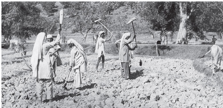
Илл. 9. Крестьяне, обрабатывающие поля

гласии с природой. Суть в том, что мы действительно почти никогда не ходим по земле босиком и потому, да и не только потому, совсем забыли о ней.