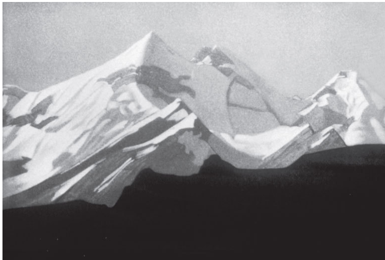
Илл. 7. С.Н. Рерих. Гепан Лагул. 1934

Видимо, совсем не случайно гора для индийца – связующее звено между миром небесным и миром земным. «До-сье», связанное с горой, в индийской культуре столь впечатляюще, что выделяет ее как очень ценный для культуры знак, насыщенный глубоким и разнообразным смыслом. Эти смыслы были заложены еще в древнюю эпоху мифотворчества, и им была суждена нескончаемо долгая жизнь. Согласно одному из древнеиндийских мифов, вначале была лишь вода, и «не было ничего, кроме вод»; «миром были воды, движущийся океан». Но эти изначальные воды несли в себе семя жизни. Со дна поднялся небольшой ком земли и плавал