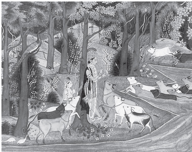
Илл. 6. Кришна-пастух. Миниатюра Раджастанской школы

ях сосредоточились на понятии единой силы, пронизывающей все сущее. Западный же дуализм духа и материи, творца и сотворенного, одушевленного и неодушевленного остался им глубоко чужд. «Дух Индии вырастает из природы, наш же дух противостоит природе», – отметил К.-Г. Юнг.