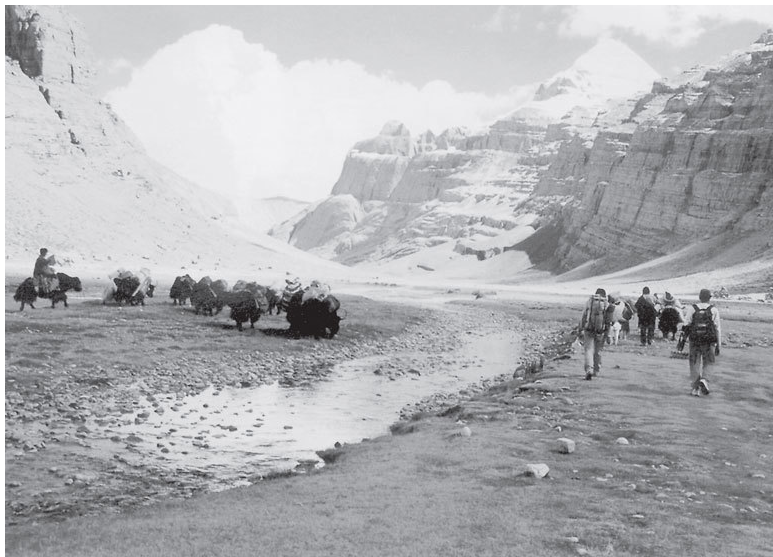
Илл. 1. Пилигримы совершают ритуальный обход горы Кайласа