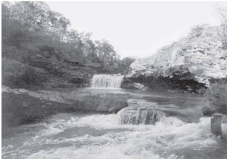
Илл. 3. Река Кангер в округе Бастар

ней южной точки Индии, мы пересечем самые разнообразные ландшафты. Первой на нашем пути встретится территория, где складывалась система реки Инд, давшая имя стране (сейчас это часть Пакистана). В древности здесь сложилась великая, мало известная цивилизация, о которой читатель сможет узнать в главе «Золушка древнего мира». На равнинах, орошаемых пятью притоками Инда – Джеламом, Ченабом, Рави, Беасом и Сатледжем, четыре-пять тысяч лет тому назад процветали города, от которых сейчас остались лишь одни развалины, погребенные под кучами песка.