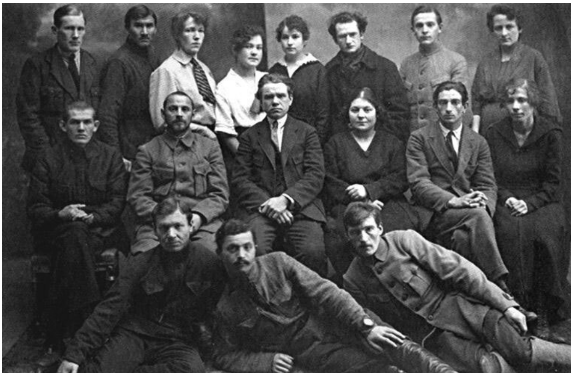
Сотрудники Восточного отдела

В закордонном отделении первоначально было шесть географических секторов, которые должны были заниматься агентурной работой за рубежом. Позднее сектора стали называться отделениями, а их число увеличивалось по мере появления новых зарубежных резидентур. Работникам зарубежных резидентур была предоставлена большая свобода в вербовке аген-