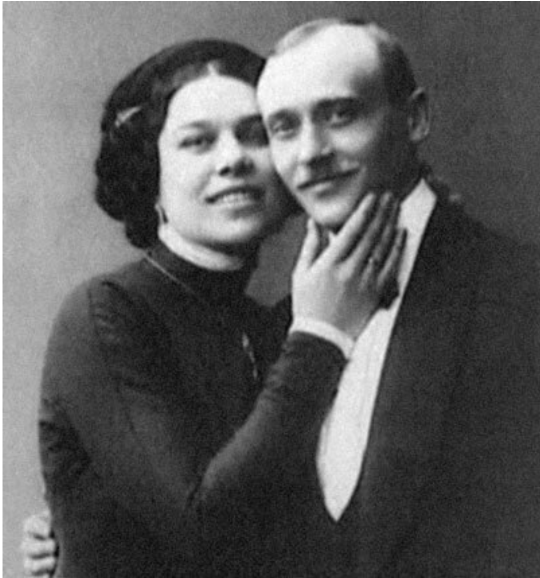
Агент ОГПУ генерал-майор Н. В. Скоблин с супругой агентом ОГПУ певицей Надеждой Плевицкой-Скоблиной. Берлин, 21 января 1931 года.