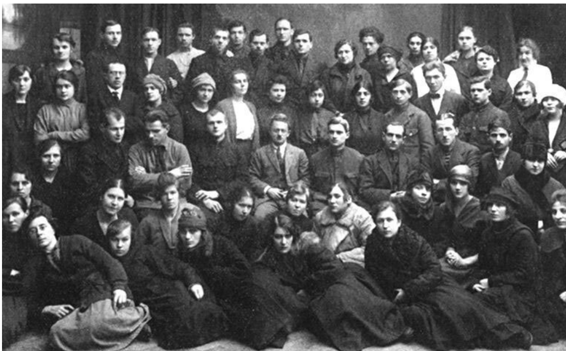
Сотрудники ИНО ОГПУ

При Трилиссере Иностранный отдел был значительно расширен и укреплен кадрами. Центральный аппарат в период его руководства отделом достигал 70 человек. А к моменту ухода Трилиссера из ИНО (1929 год) общий штат ИНО достиг 122 человек, из них 62 человека – сотрудники резидентур за рубежом. Кроме того, для решения вышеперечисленных задач была несколько изменена структура ИНО 27 .