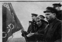
Дважды Герои Советского Союза подполковник САФОНОВ Б. Ф., принимающий Гвардейское Знамя, читает текст КЛАТВА Гвардейцев.

Успешно воюют и уничтожают фашистскую авиацию летчики-истребители. Только один 2-й Гвардейский и Краснознаменный авиаполк имени Бориса Сафонова за 2 года войны сбил 303 немецких самолета.