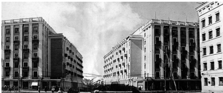
Довоенная фотография проспекта Сталина в Мурманске