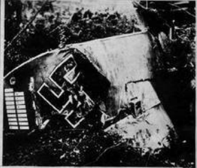
На снимках: (в центре) советский истребитель на боевом задании, (слева и справа) — сбитые летчиками-североморцами машины фашистских асов-бандитов.