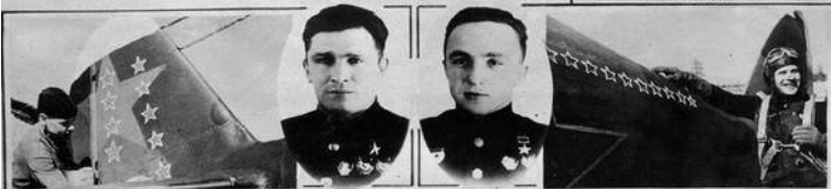
9 сбитых фашистских самолетов — таков боевой счет этой машины.