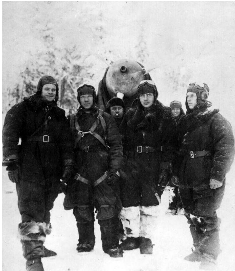
Летчики 145-го ИАП на фоне ЛаГГ-3

В конце 1941 и начале 1942 года в авиации Карельского фронта, в том числе в ВВС 14-й армии, шел интенсивный