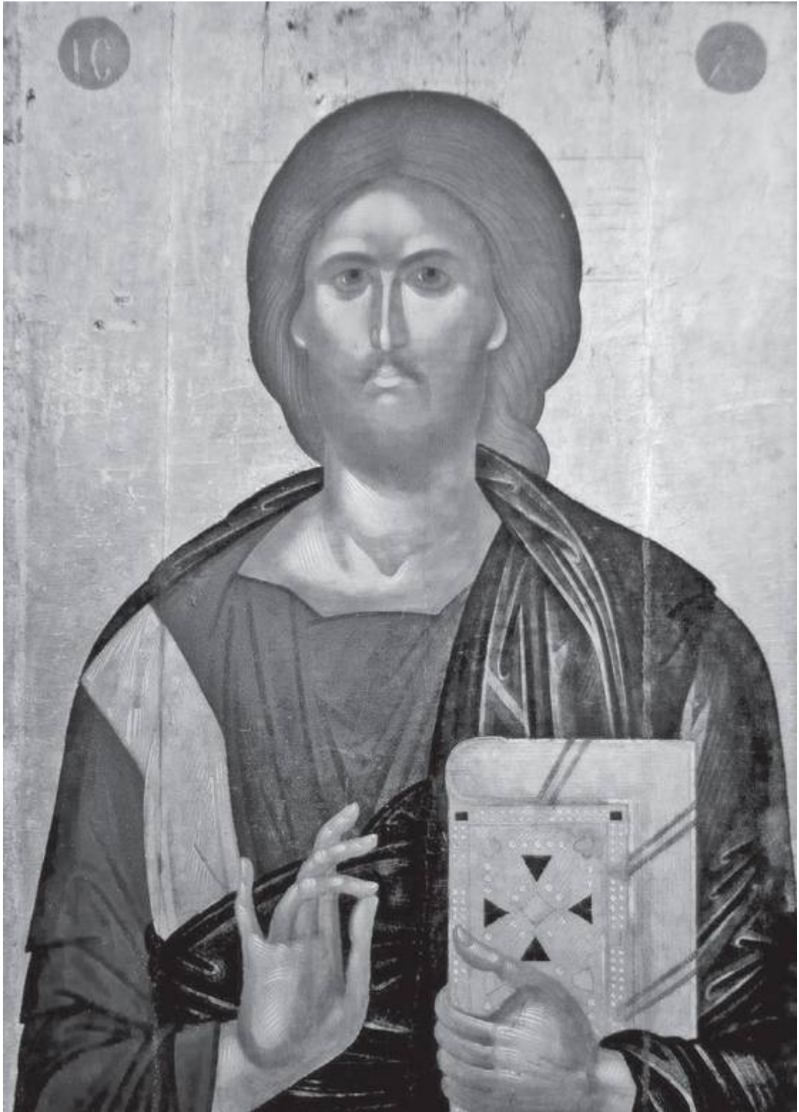
Христос Пантократор. XV век