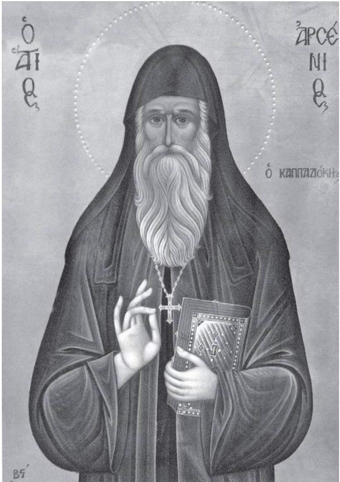
Преподобный Арсений Каппадокийский. Современная греческая икона

• Когда будущий старец был еще ребенком, один знакомый рассказал ему теорию Дарвина. Будущий святой очень расстроился, уединился и несколько часов молился Богу о врачевании. Ему явился Христос и сказал: «Я есть Воскресение и Жизнь. Верующий в Меня, если и умрет, оживет». Все сомнения на этом закончились.